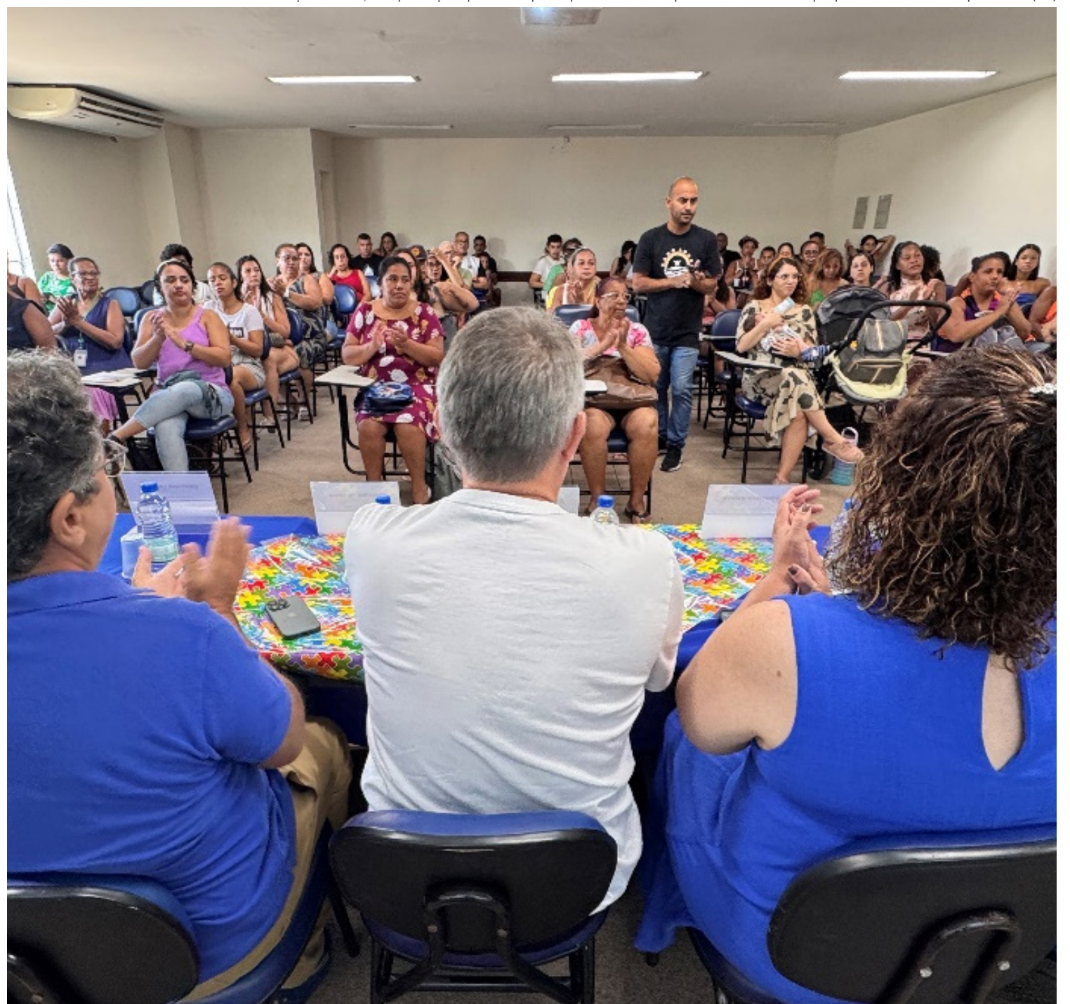
No mês da Conscientização do Autismo, município reforça compromisso com políticas públicas inclusivas e amplia acesso a direitos essenciais para pessoas com Transtorno do Espectro Autista (TEA)