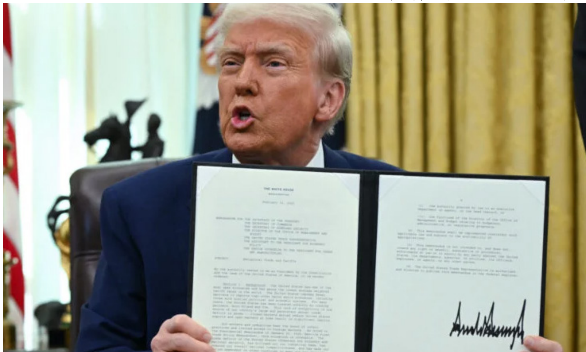
Trump assina ampliação de tarifas para comércio com EUA em fevereiro

"O episódio entre Estados Unidos e Brasil deve nos ensinar definitivamente que, nas horas