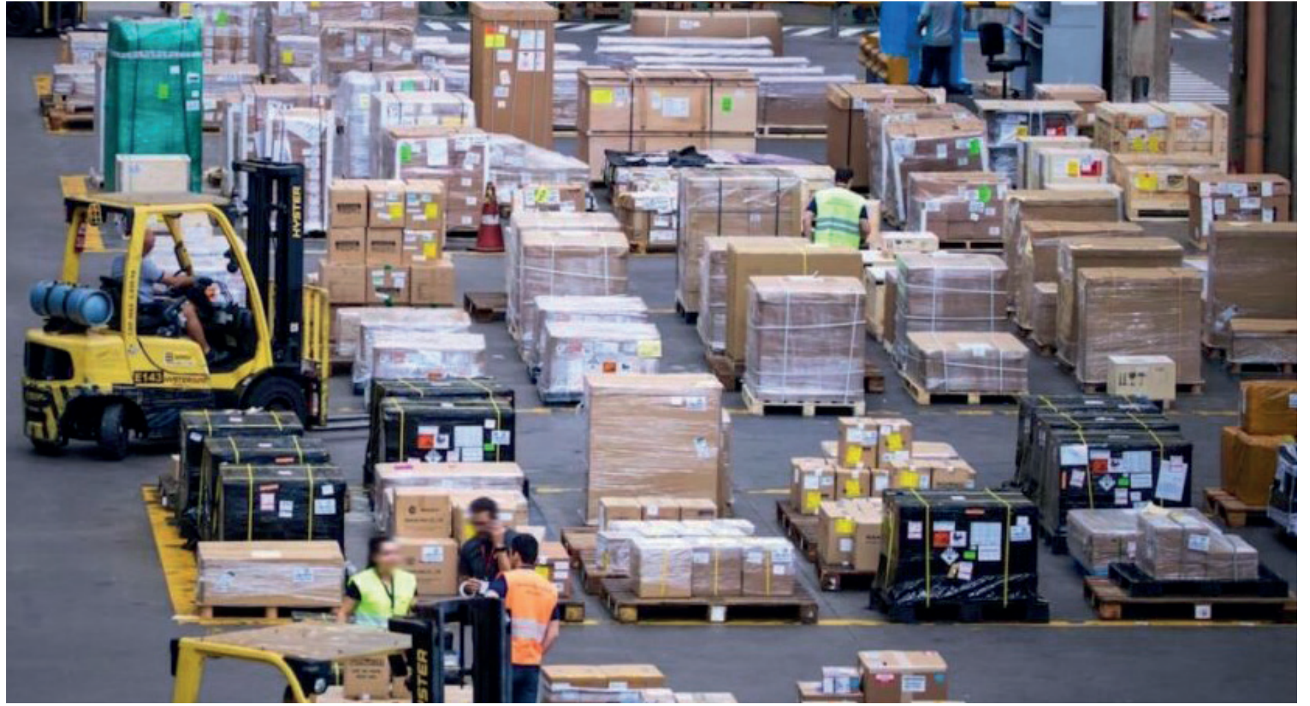
Mais de 86% das importações brasileiras estão submetidas a alguma restrição, segundo levantamento

Em seguida vêm União Europeia (94,3%) e Canadá (88,9%). Depois do Brasil, estão listados os seguintes países: Estados Unidos (77,4%);