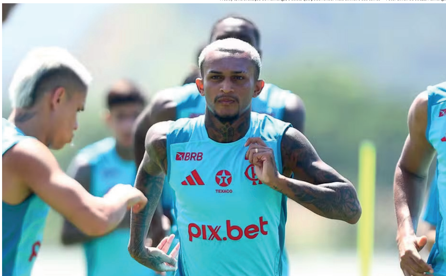
Wesley é, na avaliação do Flamengo, o atleta que pode render mais dinheiro aos cofres

A declaração acima foi dada por Bap durante apresentação no Conselho Deliberativo na semana passada. O jogador em questão, que não teve o nome