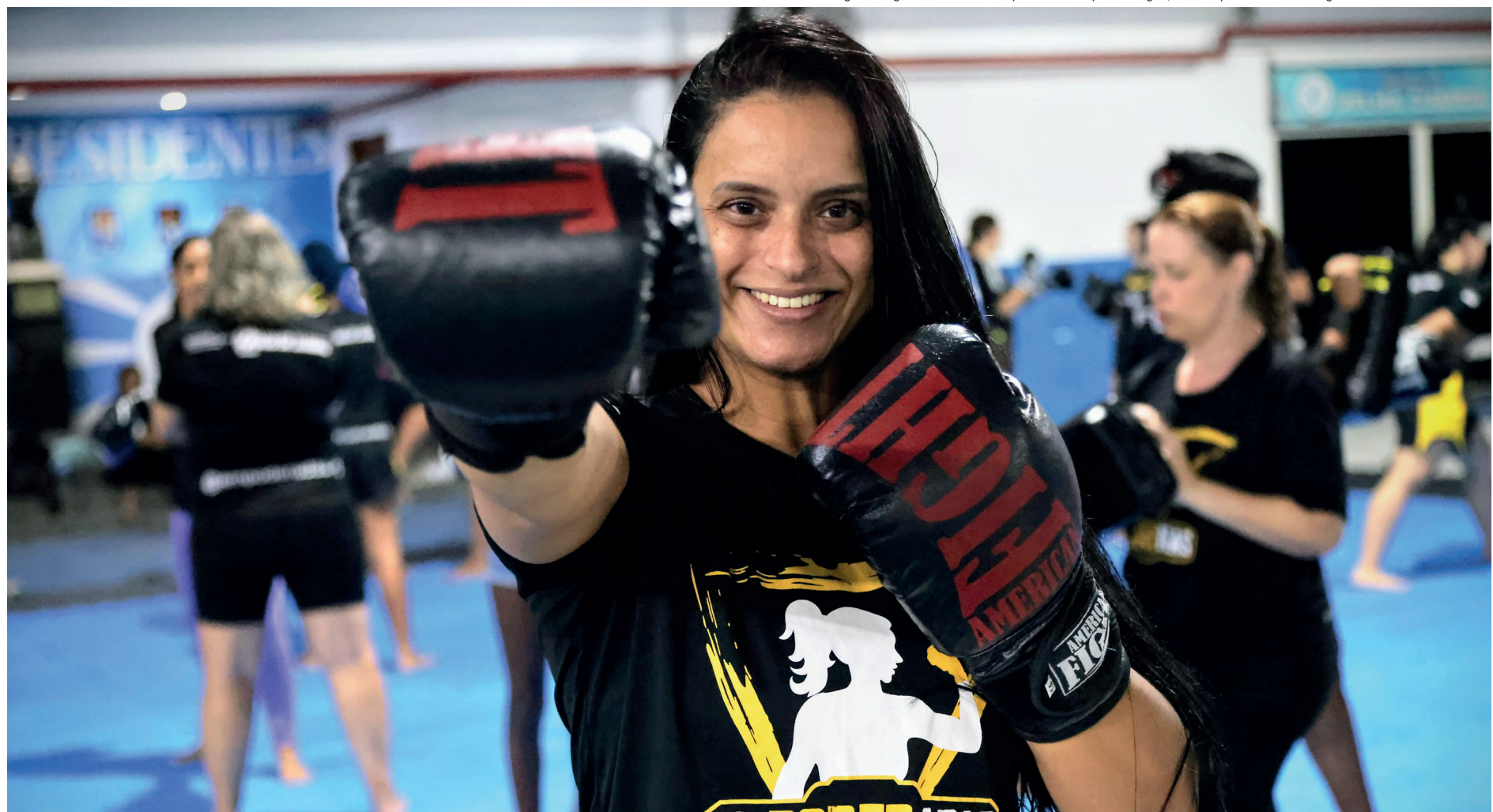
Programa do governo do Estado está presente em 12 polos na região, uma das que mais concentra registros de crimes contra a mulher

— O enfrentamento à violência contra a mulher é uma questão fundamental, pois o respeito e a dignidade delas é essencial para uma sociedade mais justa e igualitária. O grande número de crimes contra as mulheres é um problema que diz respeito a todos, e o nosso compromisso é fortalecer iniciativas que impulsionam as mulheres principalmente em relação à liberdade, autonomia e segurança — destacou o governador Cláudio Castro. O projeto é uma das iniciativas