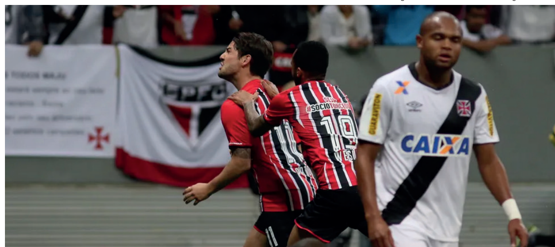
Vasco x São Paulo - gol Pato

o São Paulo pelo Brasileirão e sofreu sua pior derrota no Novo Mané Garrincha. Os paulistas venceram por 4 a 0.