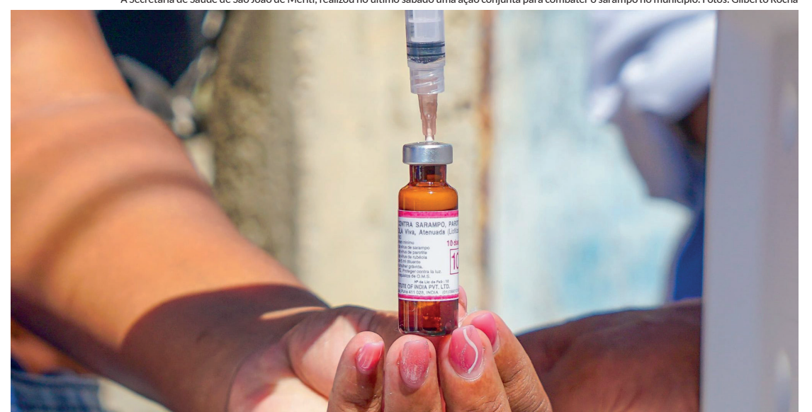
A Secretaria de Saúde de São João de Meriti, realizou no último sábado uma ação conjunta para combater o sarampo no município.

Embora o Brasil possua o certificado de erradicação do sarampo, casos pontuais ainda podem surgir, como ocorreu no município neste mês, com a identificação de dois casos. Para conter a disseminação da