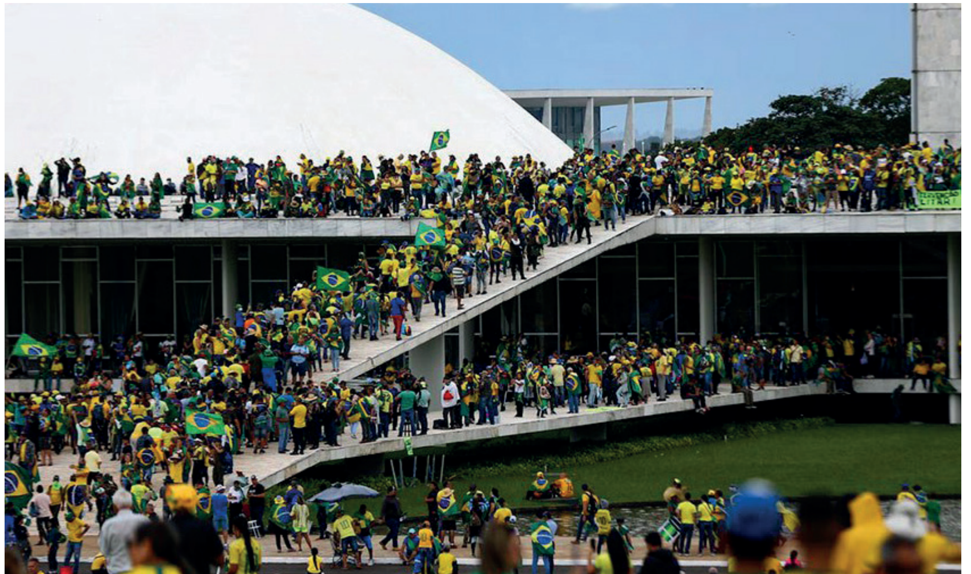
Proposta foi feita a cerca de mil denunciados, mas só 527 aceitaram até agora pagar multa, ficar longe das redes sociais e fazer curso sobre democracia

Para Barroso, o dado serve para “desmistificar a ideia de que nós estamos lidando com o ambulante ou com a costureira que foi a Brasília invadir”. “São pessoas que têm o radicalismo ideológico a ponto de preferir a condenação a aceitarem o acordo de não persecução em