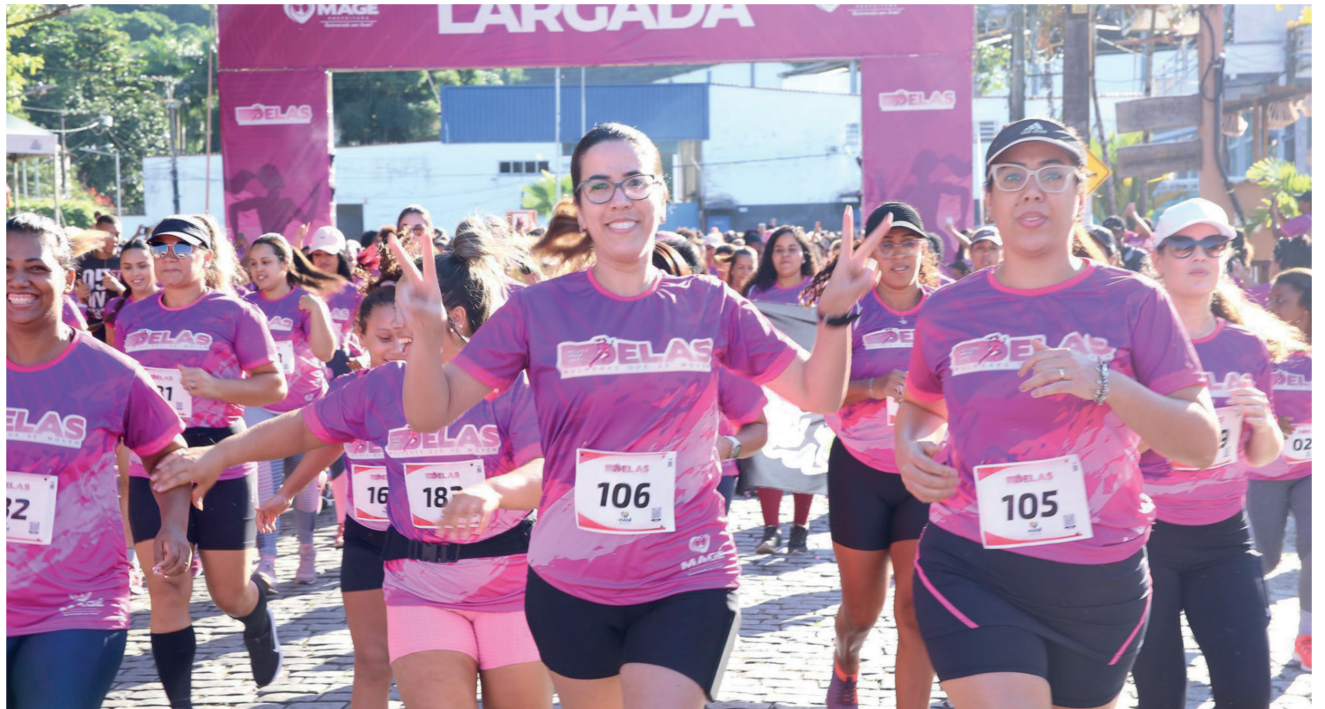
Evento reuniu milhares de participantes em 2024