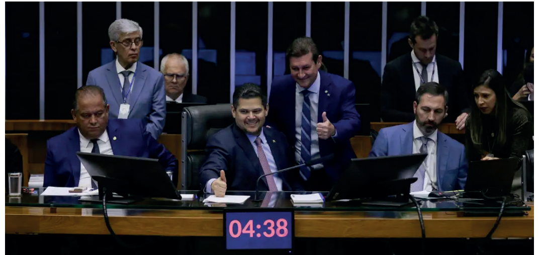
Repases foram suspensos pelo STF, que cobrava mais transparência

O relator da proposta, senador Eduardo Gomes (TO-PL), rebateu as críticas, informando que será possível identificar, em ata, as solicitações de emendas apresentadas pelas