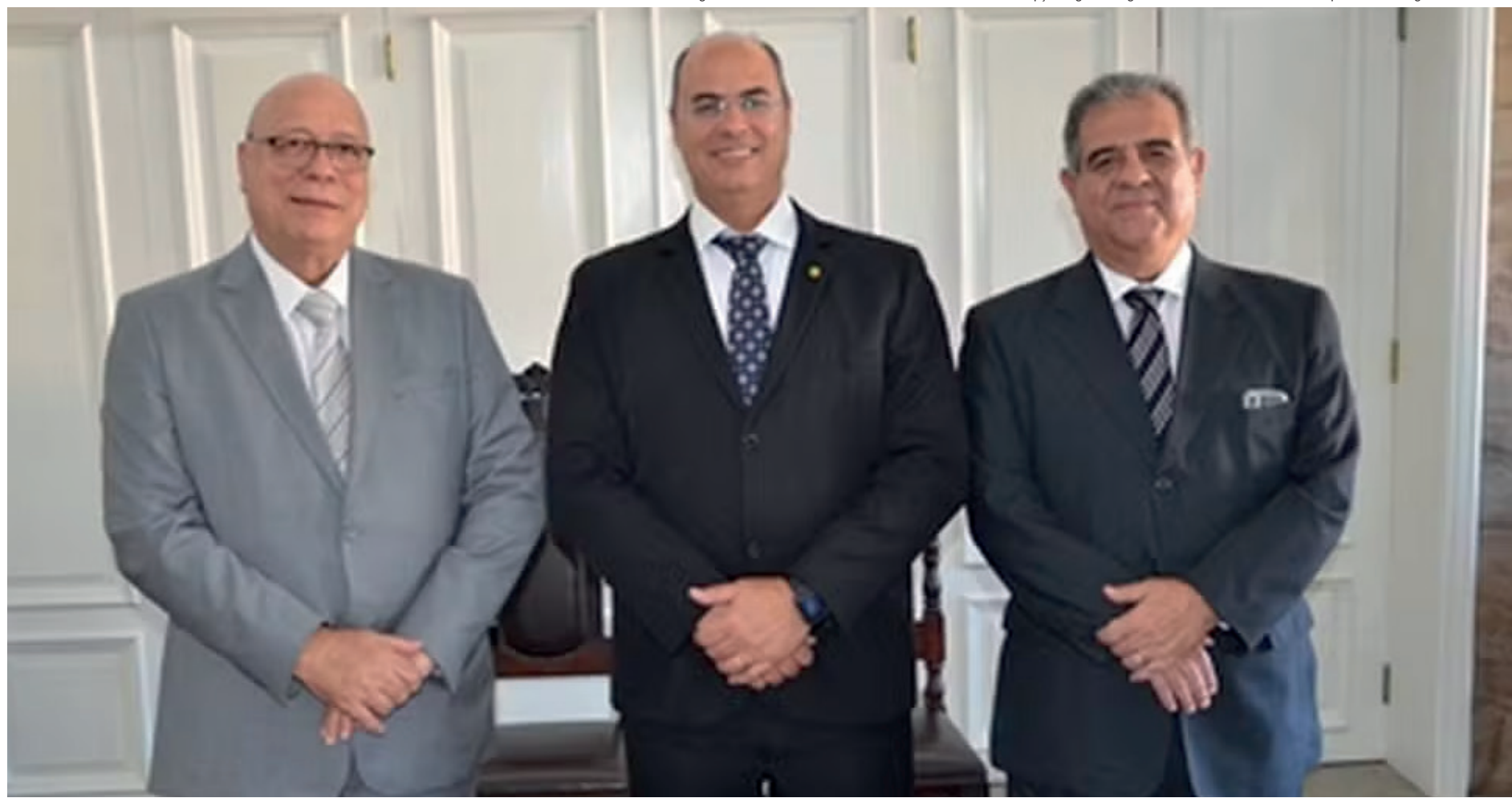
Desembargadores foram acusados de envolvimento num escândalo de corrupção na gestão do governador cassado Wilson Witzel. Um quarto desembargador foi absolvido.

quatro desembargadores do TRT do Rio chegaram a ser presos na Operação Mais Valia da Polícia Federal, mas depois conseguiram o direito de responder em liberdade.