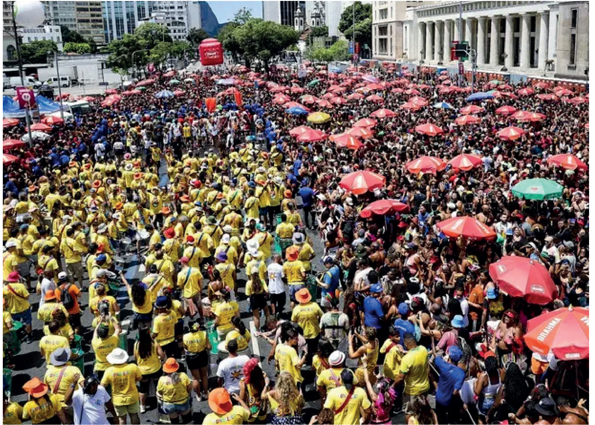
Segundo dados foram divulgados nesta quinta-feira (6), foram 50 registros neste ano, contra 139 em 2024

“Quando a gente fala da expertise das forças de segurança em atuar nesses grandes eventos, e obviamente tentar tirar alguma coisa de positivo ou uma forma de aplicar isso no dia a dia, a gente tem que enxergar de duas formas diferentes. Isso que a gente vê em grandes eventos, isso é o que o mundo inteiro age e é a forma de criminalidade ordinária. E tem o extraordinário que a gente vive só no Rio de Janeiro, que é a quantidade de criminosos armados no Rio de Janeiro. Então essa força extraordinária requer uma complexidade um pouco maior