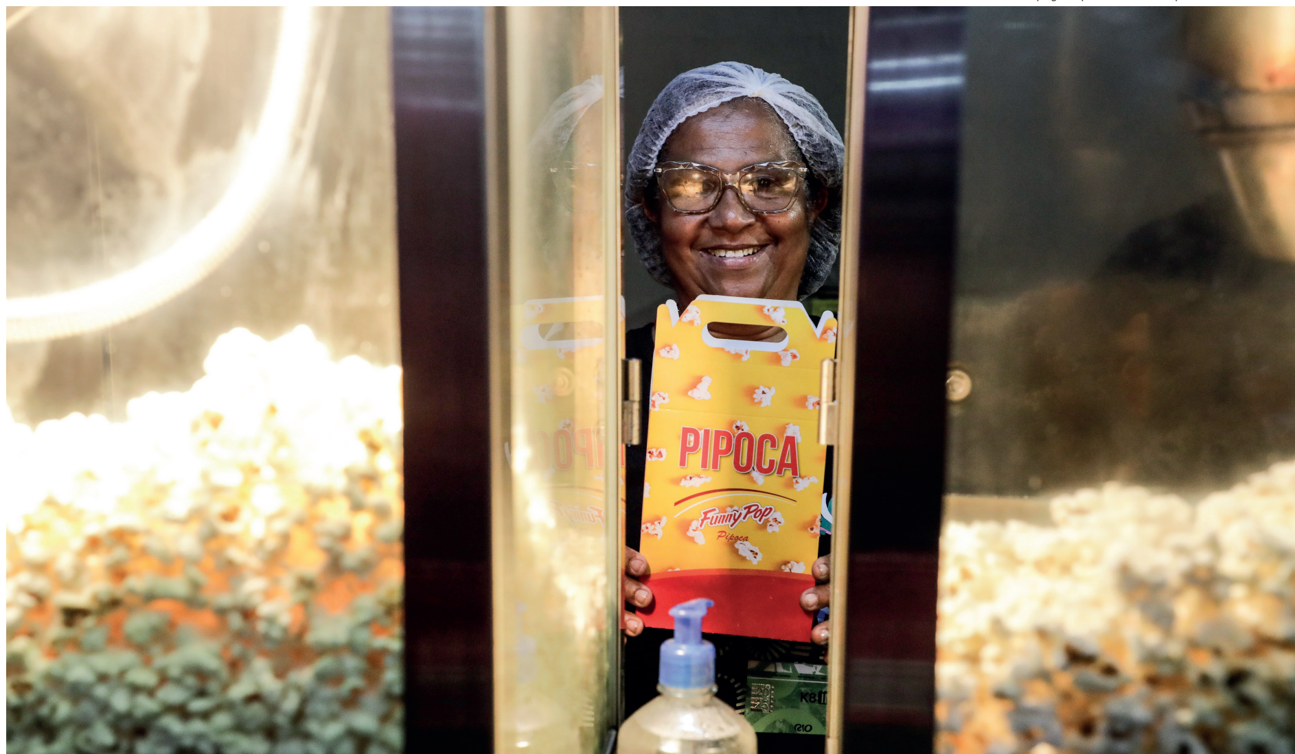
Emprego temporário trouxe ânimo para trabalhadores cariocas

– Quando aparece uma chance, a gente tem que agarrar com unhas e dentes. Trabalhar