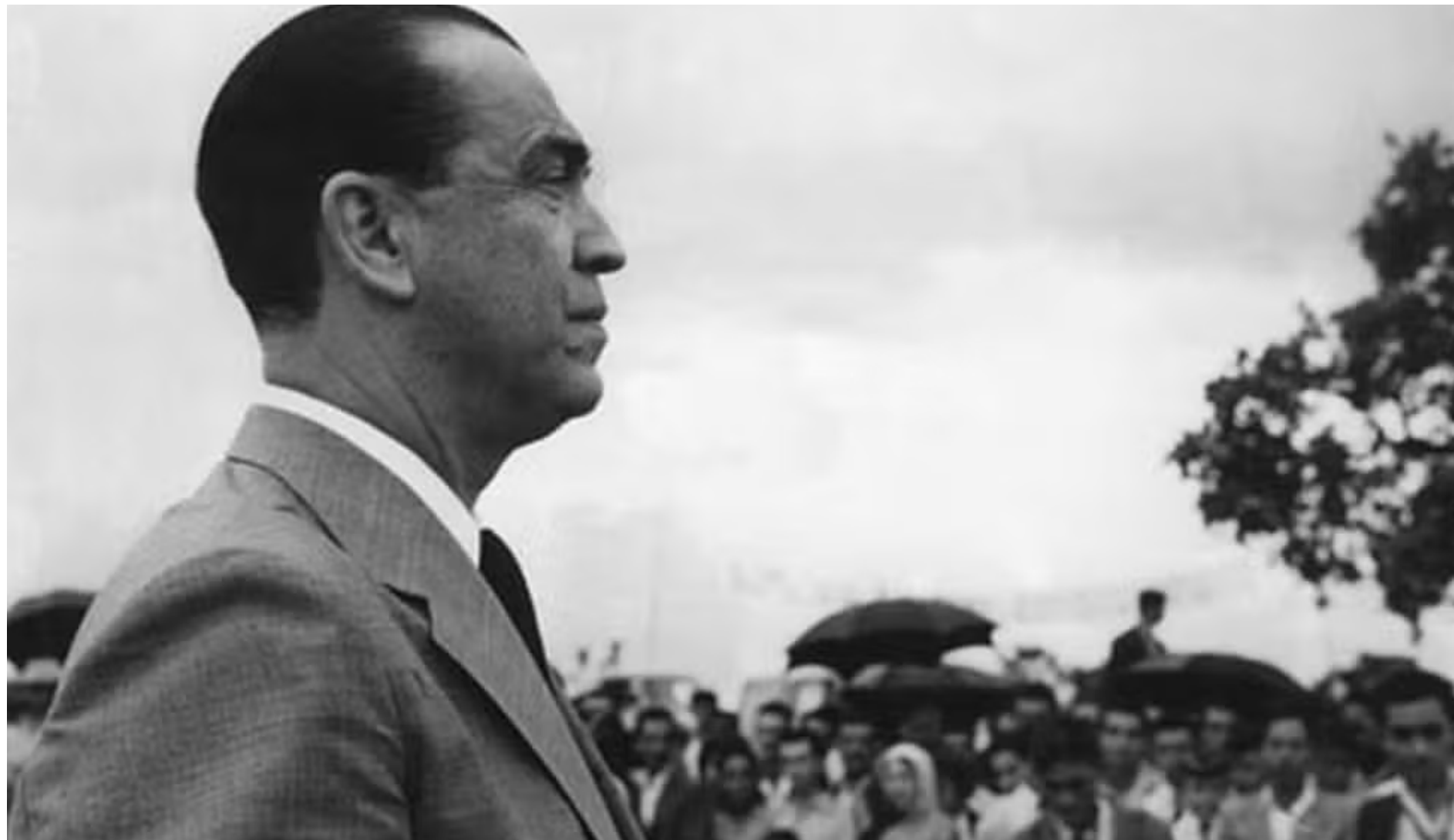
Foto de perfil do ex-presidente Juscelino Kubitschek.

A Comissão Especial de Mortos e Desaparecidos Políticos (CEMDP) pode reanalisar o caso da morte do ex-presidente Juscelino Kubitschek.