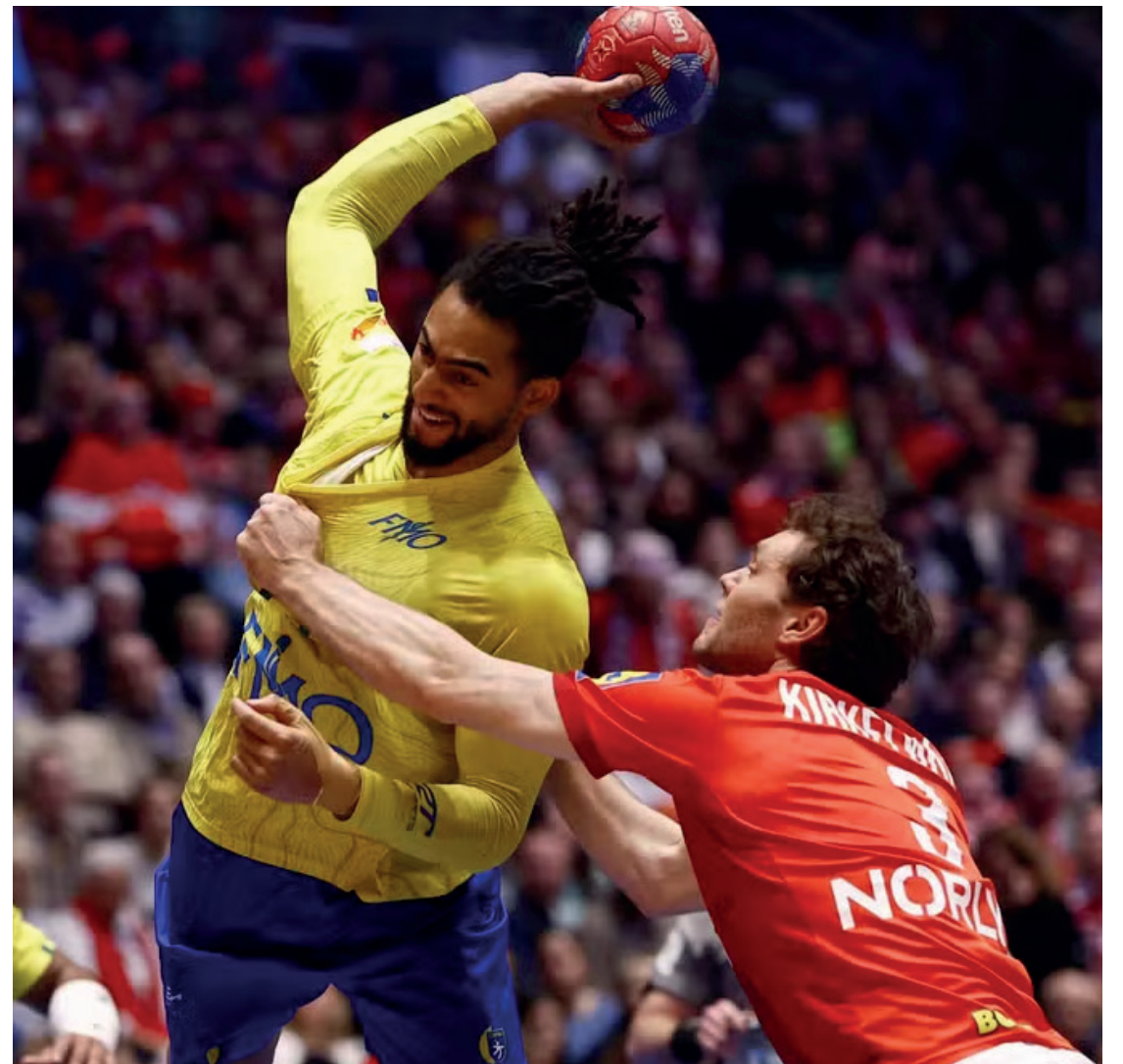
Bryan no Mundial masculino de handebol

A seleção brasileira volta ao país com uma campanha histórica e projeções otimistas para os próximos ciclos internacionais.