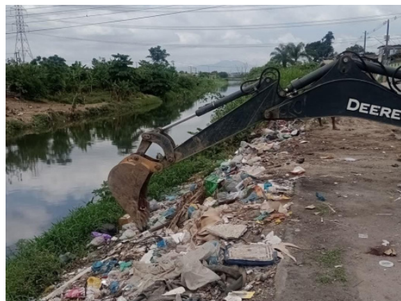
MATÉRIA COMPLETA PÁG 4

Trabalho de limpeza e dragagem abrange os rios Sarapuí, Botas, Maxambomba, além do canal do Outeiro