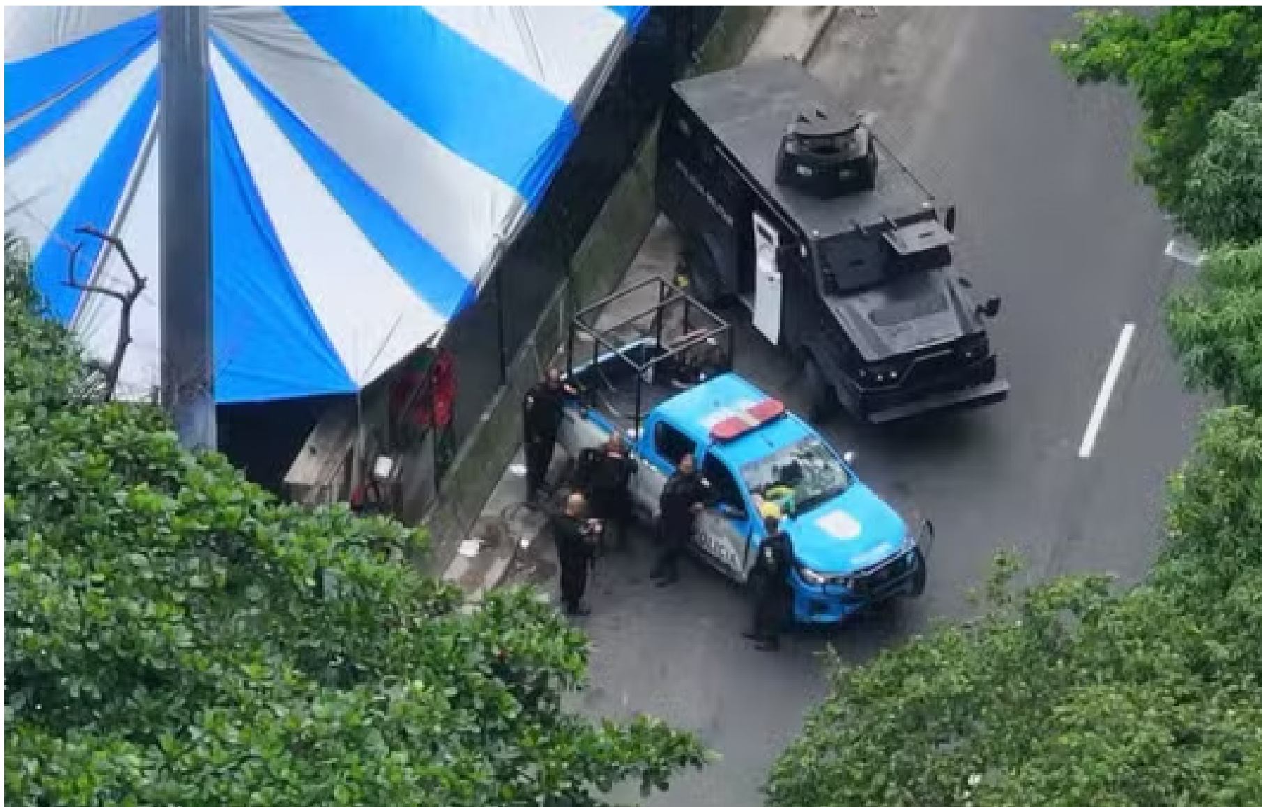
Cerca de 400 policiais militares, de 11 batalhões, iniciaram uma operação na Rocinha