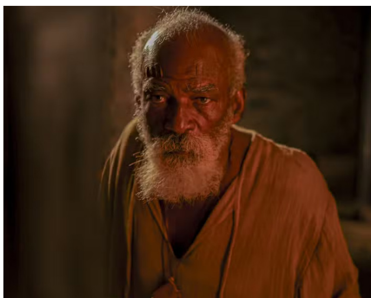
A segunda edição da Mostra de Inovação Cultural e Artística de Maricá (MICA) começa com grande estilo