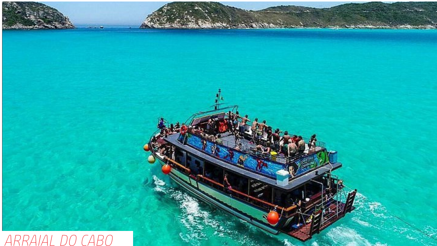
ARRAIAL DO CABO

O benefício terá duração de seis meses, renovável por igual período mediante prestação de contas. Para detalhes, acesse o edital em saquarema.rj.gov.br.