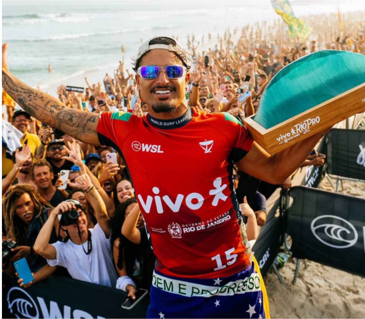
EY, explica: “O estudo da EY avalia os impactos gerados pelo evento. A presença