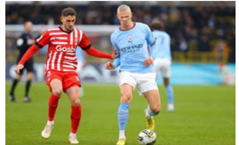
Haaland em ação em amistoso entre Manchester City e Girona; equipes pertencem ao Grupo City

proprietários, como Milan e Toulouse, Brighton e USG, e Aston Villa e Vitória de Guimarães, que