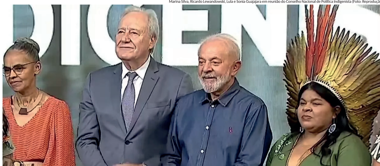
Marina Silva, Ricardo Lewandowski, Lula e Sonia Guajajara em reunião do Conselho Nacional de Política Indigenista

O presidente Luiz Inácio Lula da Silva (PT) anunciou nesta quinta-feira (18) a demarcação das terras indígenas Caciue Fontoura, no Mato Grosso, e Aldeia Velha, na Bahia, durante reunião do Conselho Nacional de Política Indigenista, em Brasília, com representações indígenas.