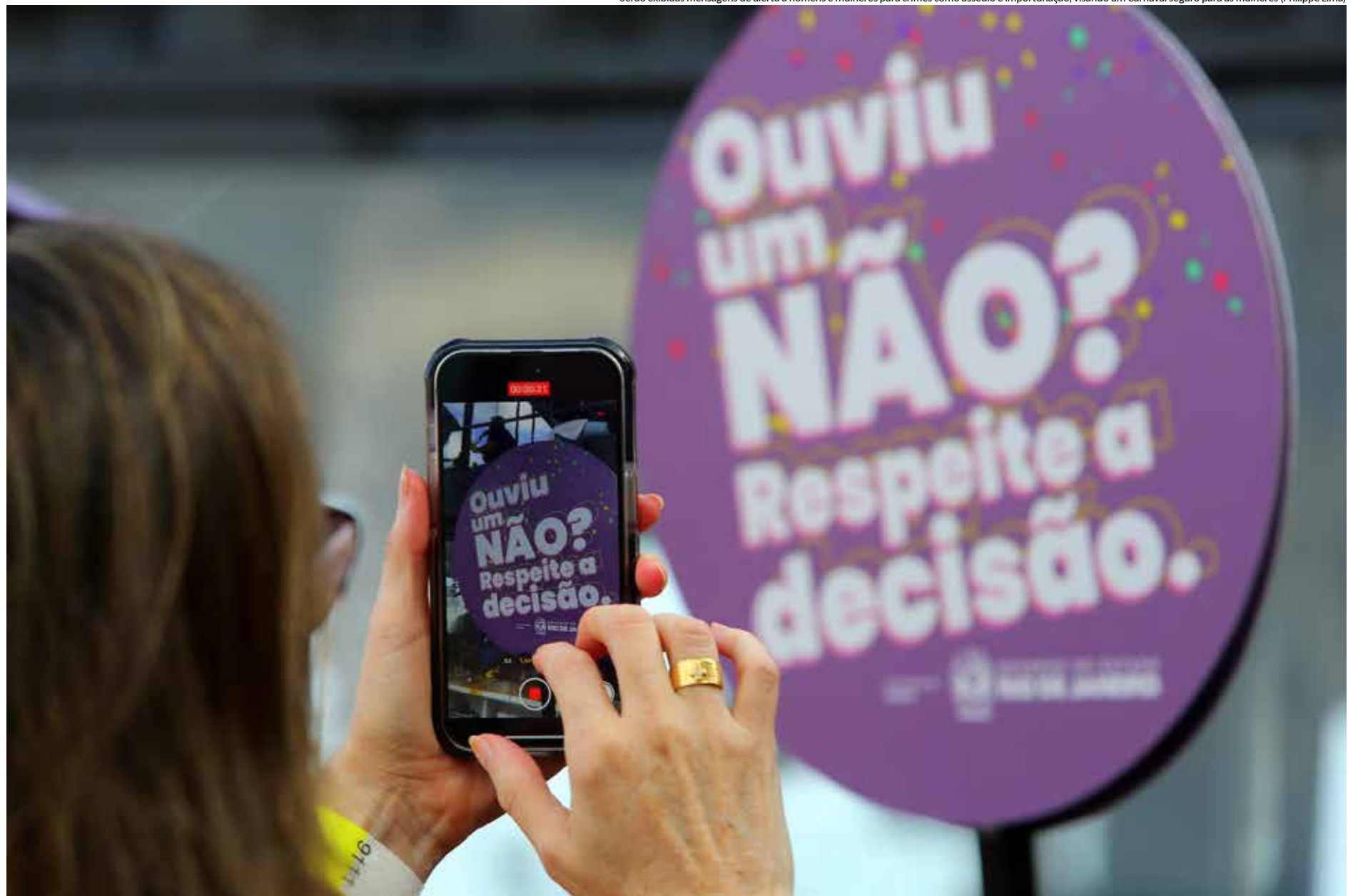
Serão exibidas mensagens de alerta a homens e mulheres para crimes como assédio e importunação, visando um Carnaval seguro para as mulheres

A Polícia Civil vai atuar no Sambódromo com o posto