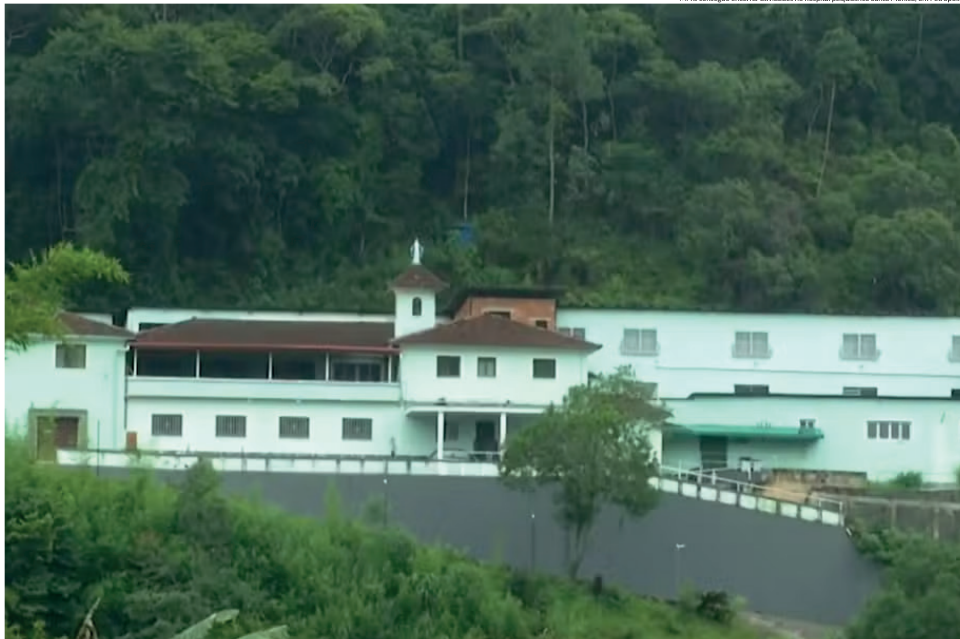
MPRJ consegue encerrar atividades no hospital psiquiátrico Santa Mônica, em Petrópolis

A situação de descuido no Hospital Santa Mônica chegou a tal