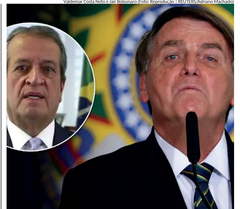
Valdemar Costa Neto e Jair Bolsonaro