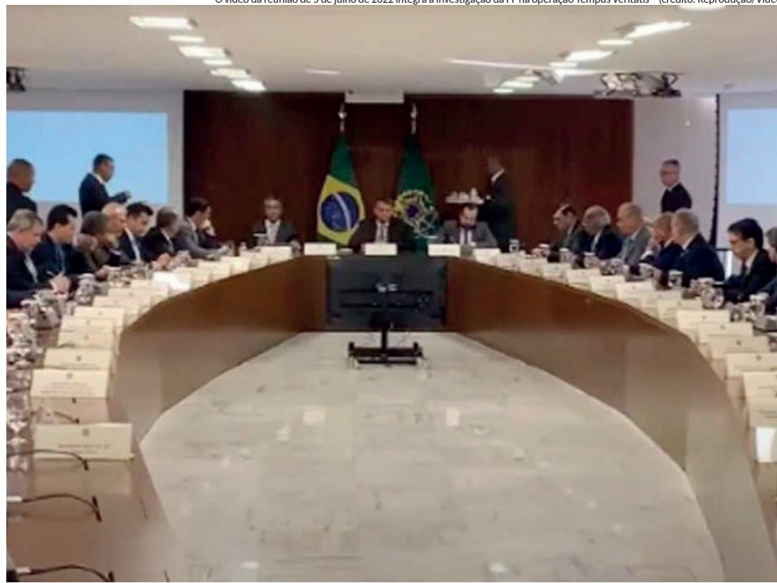
O vídeo da reunião de 5 de julho de 2022 integra a investigação da PF na operação Tempus Veritatis

Oficialmente, o conselheiro ainda está lotado na área de imprensa do Ministério das Relações Exteriores, mas já vinha despachando também na Secom, e contribuiria no grupo de trabalho sobre o G20. O ofício com pedido de sua transferência, feita pelo Planalto, ainda não havia sido assinado pelo chanceler Mauro Vieira.