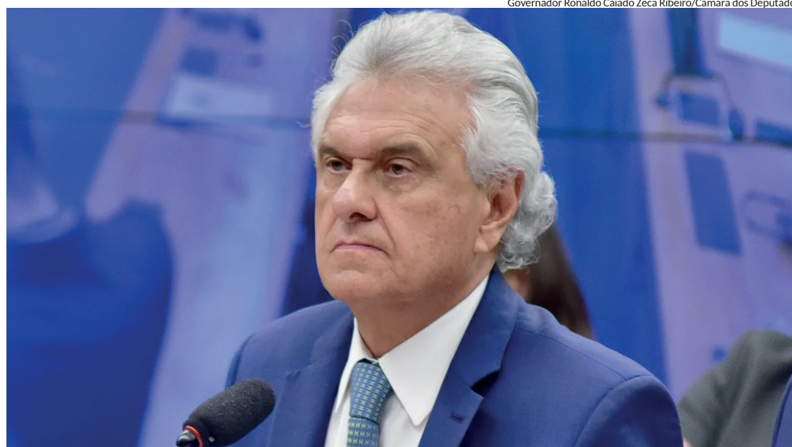
Governador Ronaldo Caiado

A ida do governador goiano ao ato em São Paulo também é vista como uma estratégia na