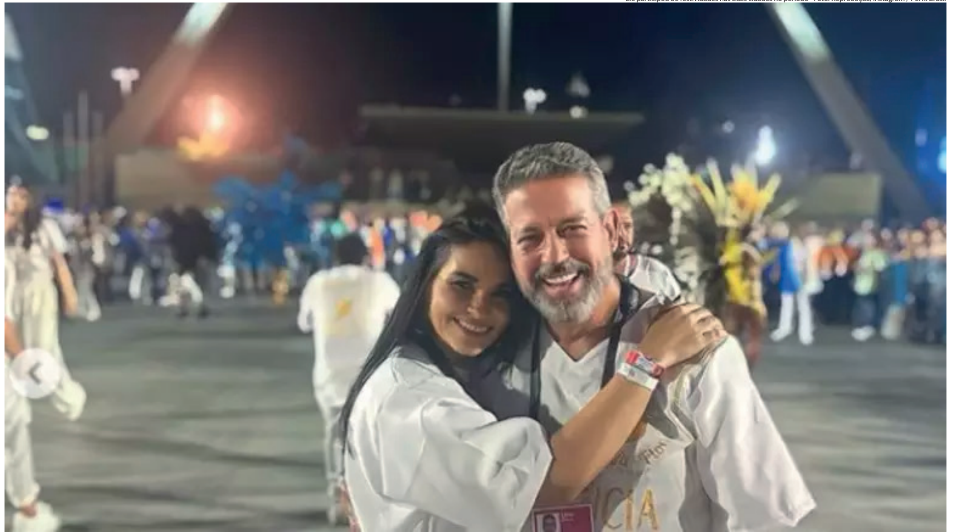
Ele participou de festividades nas duas cidades no período

"Hoje, sinto imenso orgulho de prestigiar Maceió brilhando na Sapucaí com o enredo da @