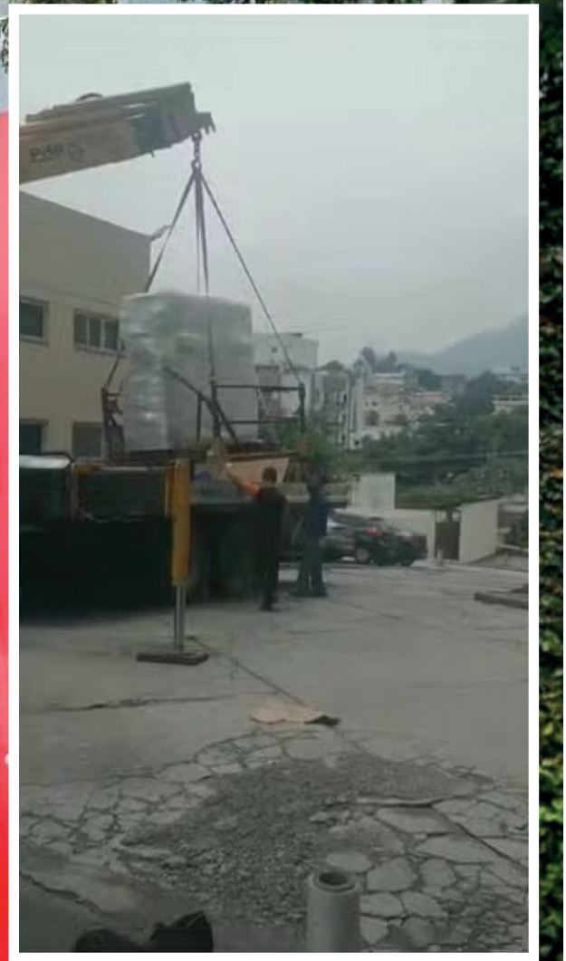
Foto: Roberto Moreyra - Agência O Globo / Hospital do Andaraí tem tomógrafo levado sem autorização — Foto: Reprodução TV Globo

ambiente de caos, com pacientes oncológicos sem acesso à quimioterapia e cirurgias complexas suspensas. A falta de médicos disponíveis levou ao fechamento da emergência para novos pacientes,