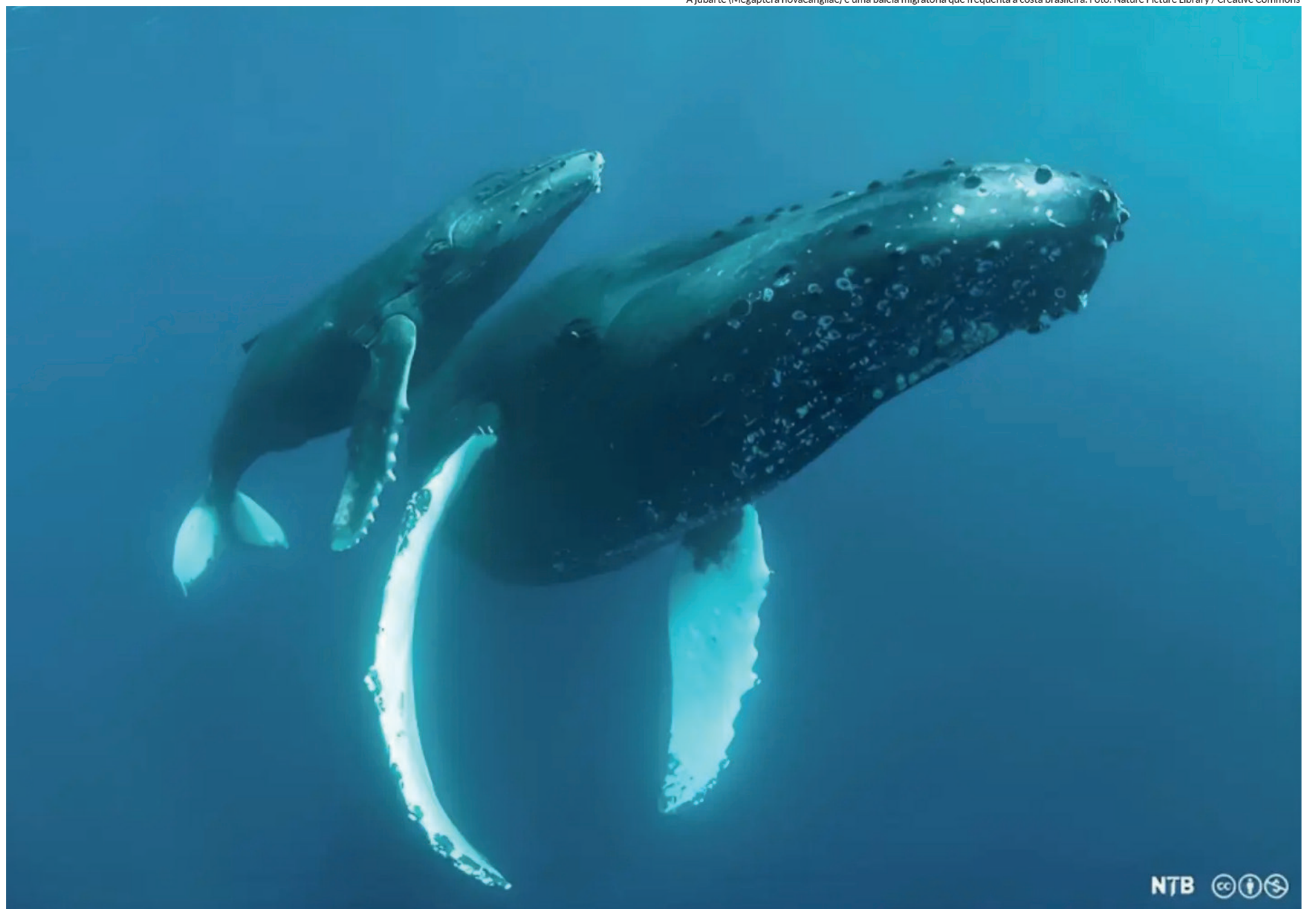
A jubarte ( Megaptera novaeangliae ) é uma baleia migratória que frequenta a costa brasileira.

"As espécies migratórias dependem de uma variedade de habitats específicos em dife-