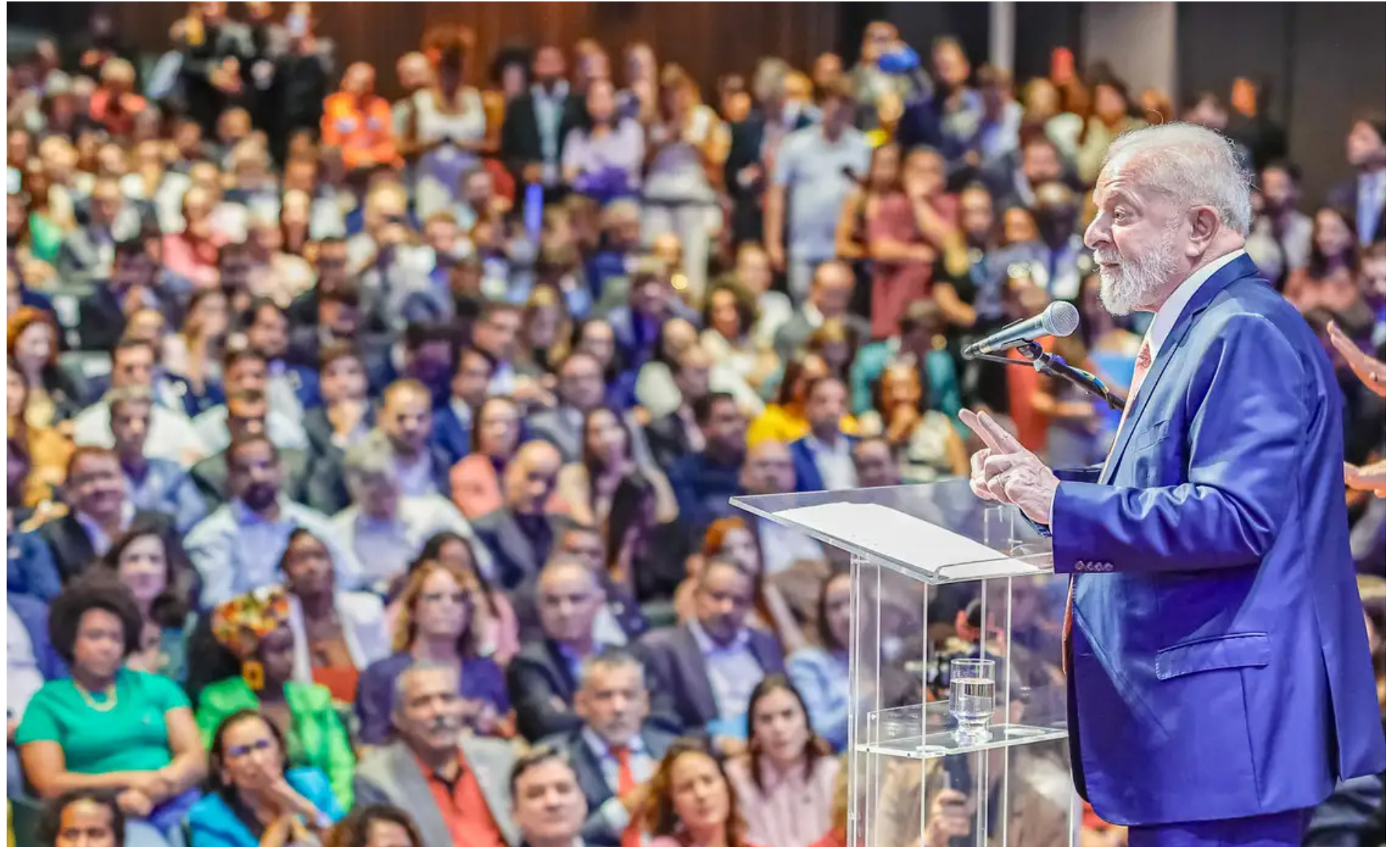
08.02.2024 - Presidente da República, Luiz Inácio Lula da Silva, durante a cerimônia de anúncio de pacote de investimentos para Minas Gerais, no Minascentro - Belo Horizonte - MG.

Para o presidente, um dos problemas do país é a desconti-