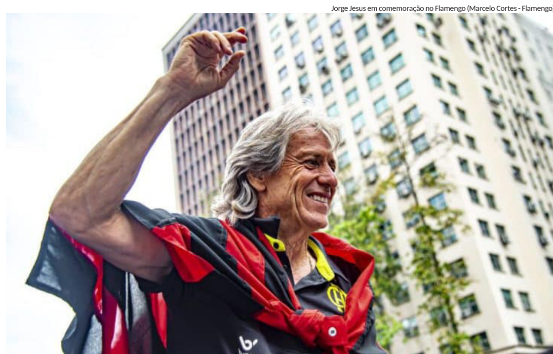
Jorge Jesus em comemoração no Flamengo (Marcelo Cortes - Flamengo)