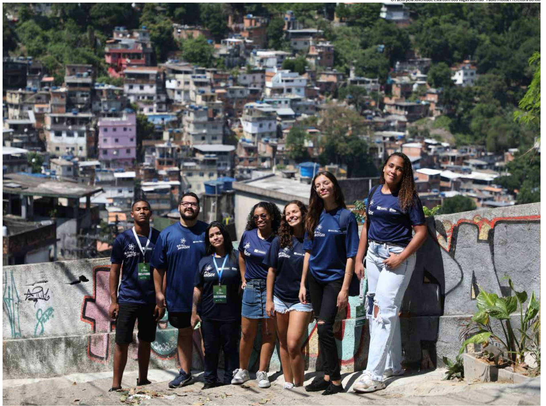
O Pacto pela Juventude está com 600 vagas abertas

O Pacto pela Juventude é um projeto desenvolvido em três diferentes etapas. Na primeira, são realizadas as oficinas formativas e ações de multiplicação de conhecimentos. Em seguida, os jovens vão a campo para conhecer a realidade das favelas onde moram para as pesquisas territoriais. Por último, o projeto final e o plano de trabalho são desenvolvidos pelos alunos que pensam em estratégias práticas para amenizar ou solucionar problemas corriqueiros ou questões de cunho social relacionadas às trilhas formativas propostas.