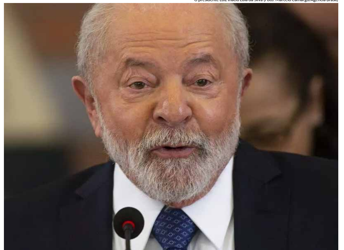
O presidente Luiz Inácio Lula da Silva

No entanto, apesar dos esforços de Temer em garantir uma abordagem mais conciliatória por parte de Bolsonaro, os resultados práticos parecem ser limitados. Integrantes do STF afirmam que as evidências sobre a atuação de Bolsonaro em uma tentativa de golpe de Estado permanecem inalteradas.