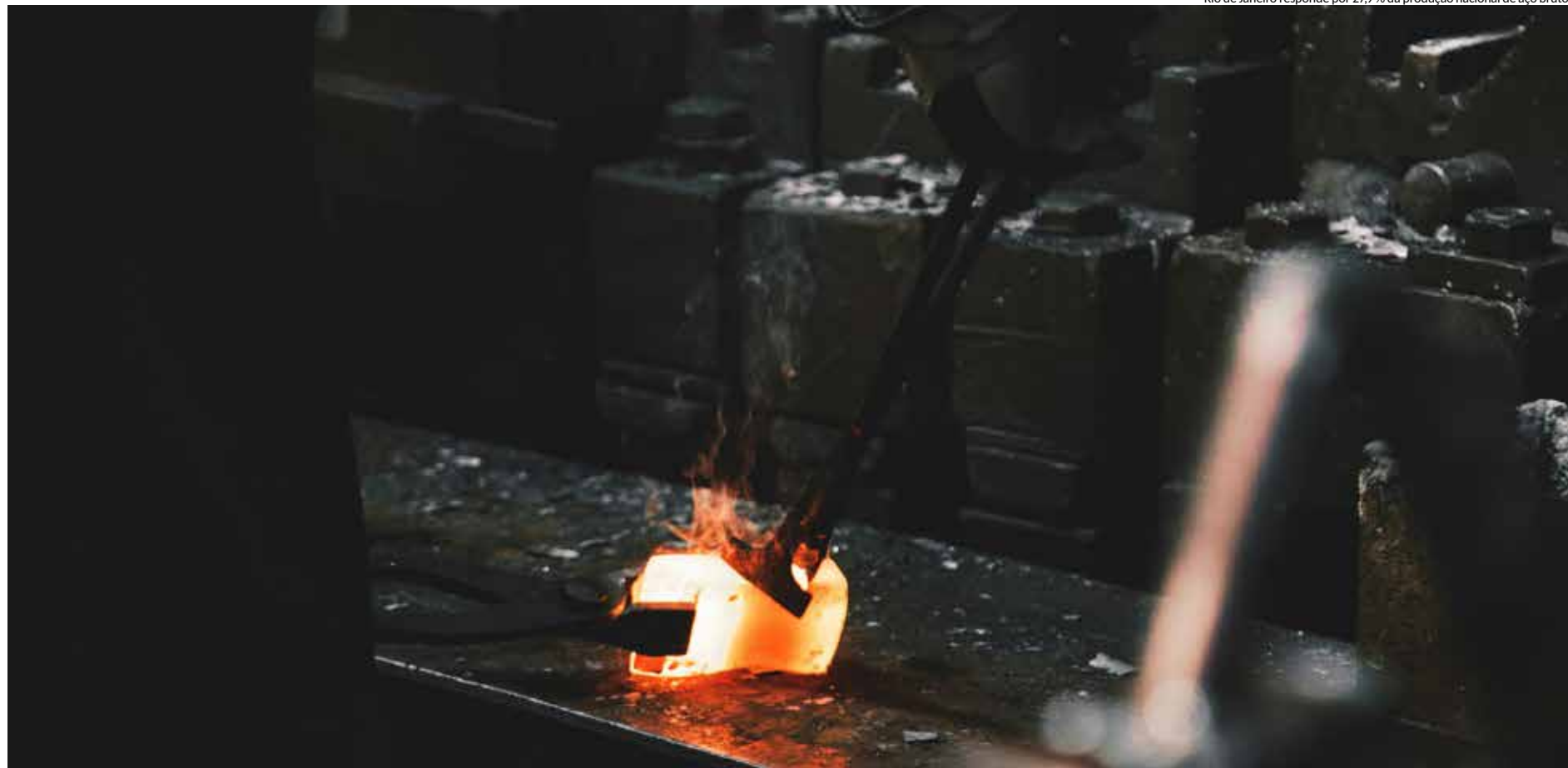
Rio de Janeiro responde por 27,9% da produção nacional de aço bruto

– A indústria siderúrgica tem expressiva relevância no crescimento econômico do Estado do Rio e do país. É grande fornecedora de insumos para diversos setores da indústria de transformação, bem como para a construção civil, que está aquecida no Rio de Janeiro, e é responsável pela geração de milhares de empregos para a população. Esse cenário tem reflexos extremamente positivos na economia fluminense,