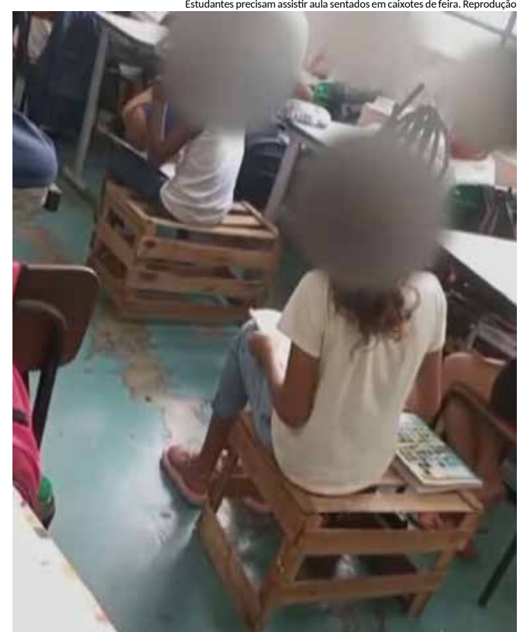
Estudantes precisam assistir aula sentados em caixotes de feira.