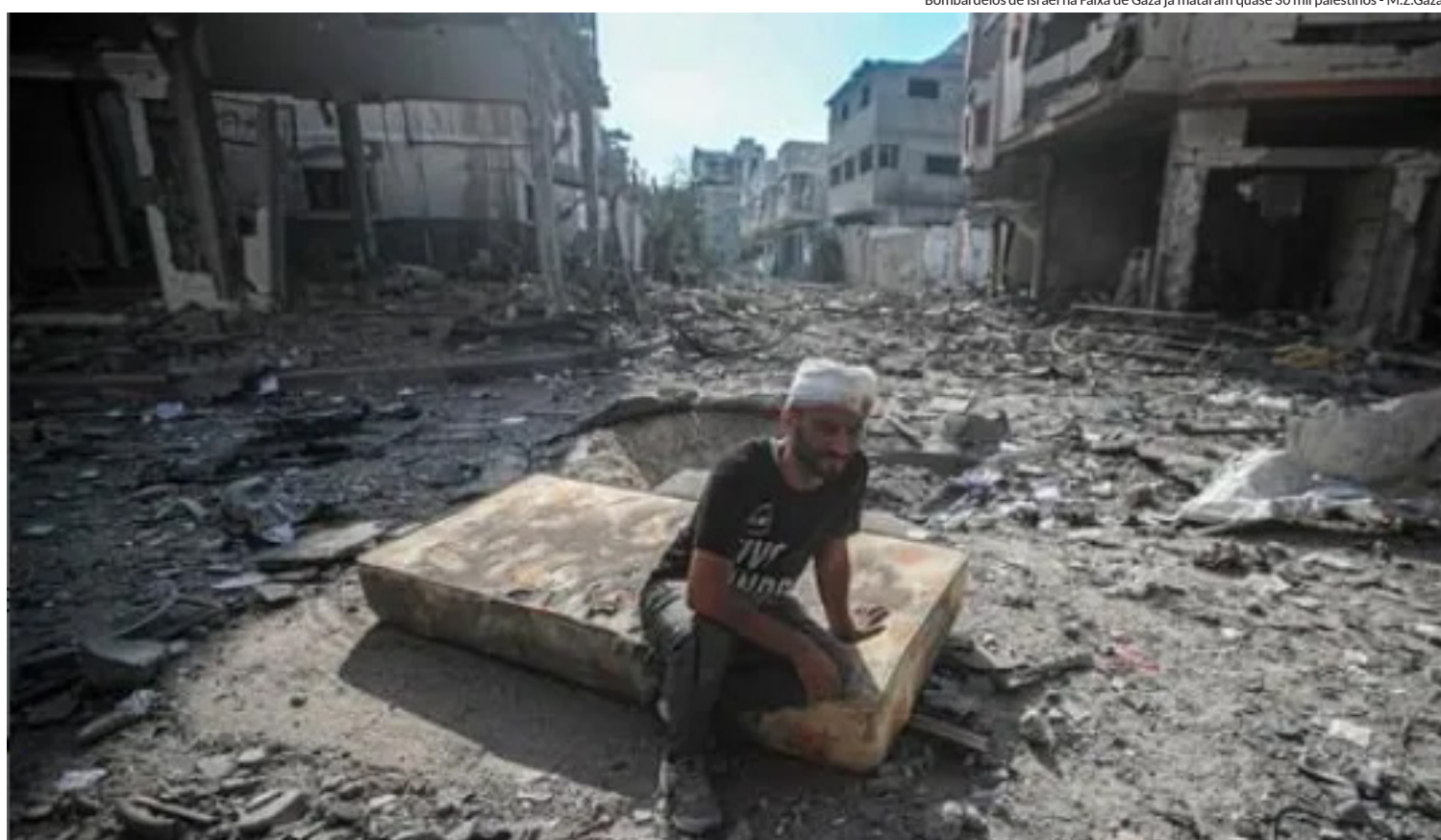
Bombardeios de Israel na Faixa de Gaza já mataram quase 30 mil palestinos - M.Z.Gaza

É esperada a participação de até 52 países, entre eles Estados