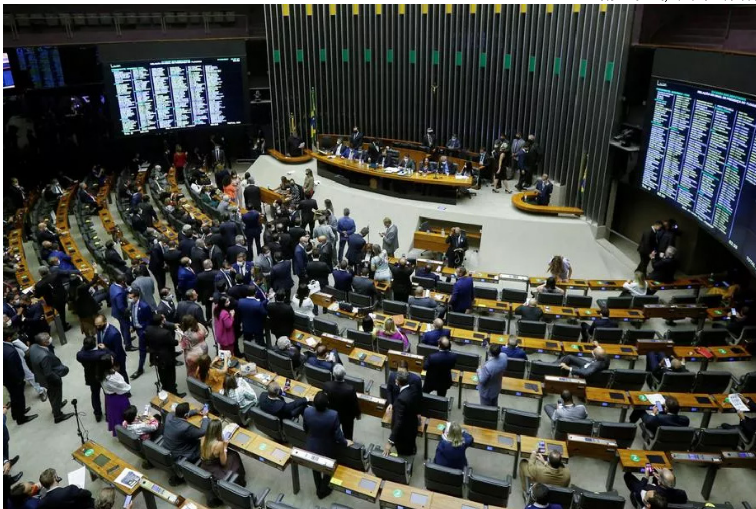
Plenário da Câmara dos Deputados

a inflação oficial durante o mesmo período — de 2013 a 2023 — foi de apenas 73%. O aumento nas tarifas de energia elétrica do Pará foi o foco de uma audiência pública na Câmara Federal, na quinta-feira, um dia após o governador Helder Barbalho questionar as autoridades nacionais de energia sobre o custo e a qualidade do fornecimento no estado. A audiência foi parte de um esforço coordenado pelo governo estadual para revisar os critérios usados na cobrança de energia. Ricardo Sefer, procurador-geral do Estado do Pará, defendeu uma reforma no sistema de tarifação, apontando para a necessidade de maior justiça e equidade, especialmente considerando que o Pará é um dos maiores produtores de energia do país, mas enfrenta a tarifa mais alta. Sandoval Feitosa, diretor-geral da Agência Nacional de Energia Elétrica (ANEEL), reconheceu que as tarifas no Pará estão acima dos índices nacionais e afirmou que a legislação precisa ser alterada para equilibrar a tarifa e estimular o desenvolvimento econômico e o bem-estar da população. A audiência contou com a presença de várias autoridades, incluindo membros do Ministério de Minas e Energia e da bancada parlamentar do Pará.