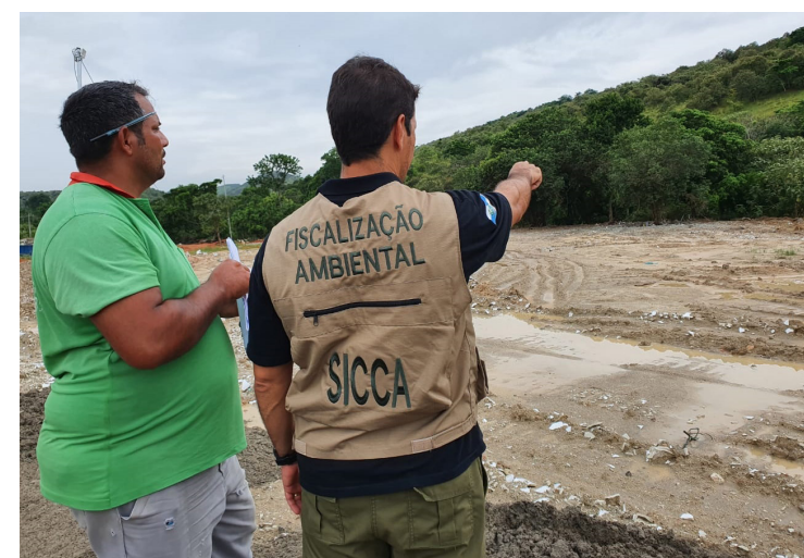
Proteção ao Meio Ambiente (DPMA), da Polícia Civil, estão buscando identificar quem descartou o material no rio Guandu.

O Instituto Estadual do Ambiente (Inea) e a Delegacia de