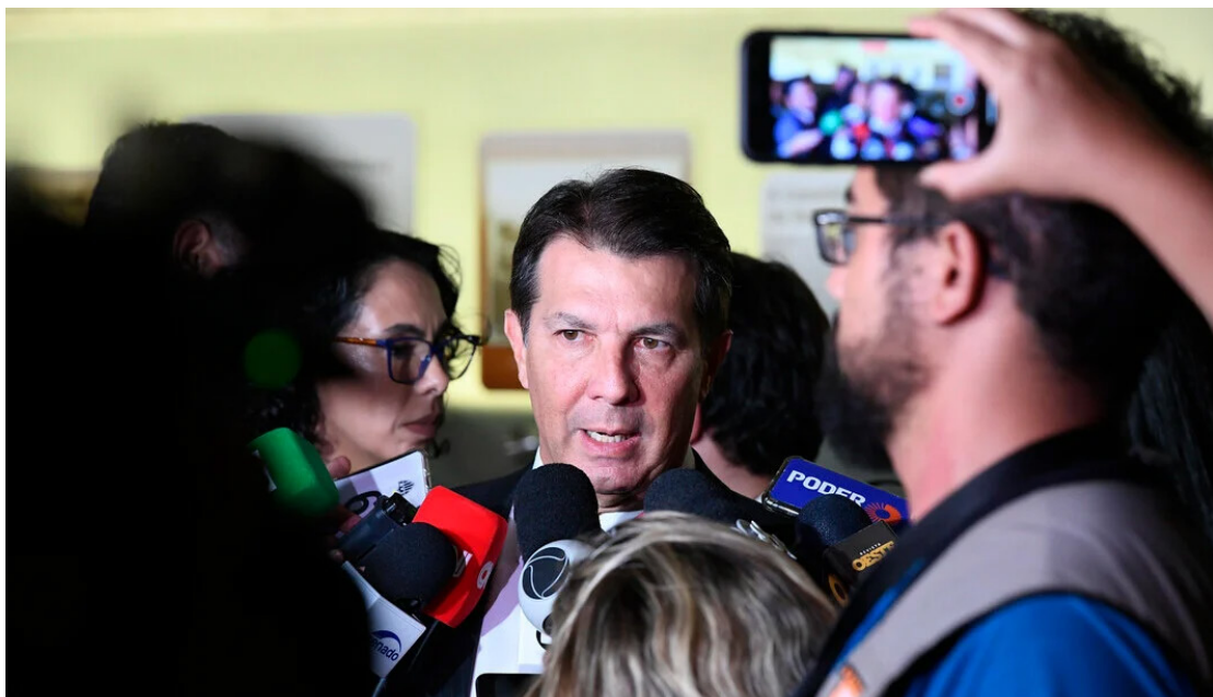
O presidente da CPMI do 8 de Janeiro, Arthur Maia (União-BA).