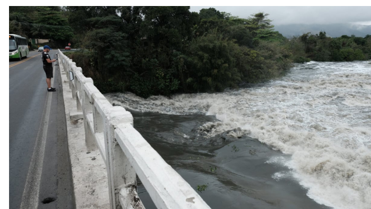
Agensera e a Delegacia de Proteção ao Meio Ambiente, para que prestem informações sobre o ocorrido.

Foram oficiados pelo GTT-SH/MPRJ e pela Promotoria de Nova Iguaçu o Inea, a Cedae, o Comitê das Bacias Hidrográficas do Guandu, a