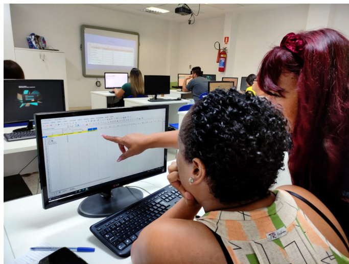
Os cursos e oficinas oferecidos pelas Naves do Conhecimento são gratuitos