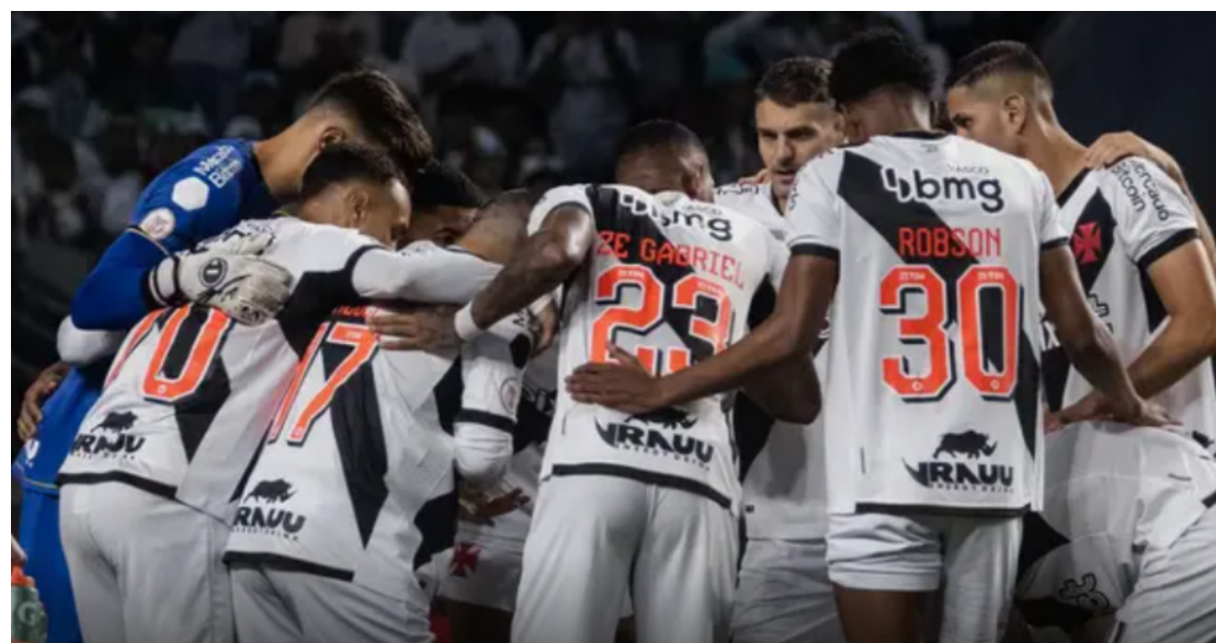
Mesmo com derrota, Vasco tem mostrado evolução nos últimos jogos

Se o Vasco quer espanhar a crise de vez e sair da zona de rebaixamento, a sequência de jogos que o espera é para se auto-afirmar na Série A do Campeonato Brasileiro e deixar para trás o fantasma de um novo rebaixamento em sua história. Nos próximos cinco jogos, quatro serão contras esses rivais diretos. Com 16 pontos, o Cruz-Maltino aparece na zona de rebaixamento ao lado de Santos, Coritiba e América. O primeiro time fora do Z4 é o Bahia. E todos esses serão rivais da equipe carioca nas próximas rodadas. Além deles, o Vasco faz o clássico com o Fluminense, em São Januário. O único problema destes confrontos é que três serão