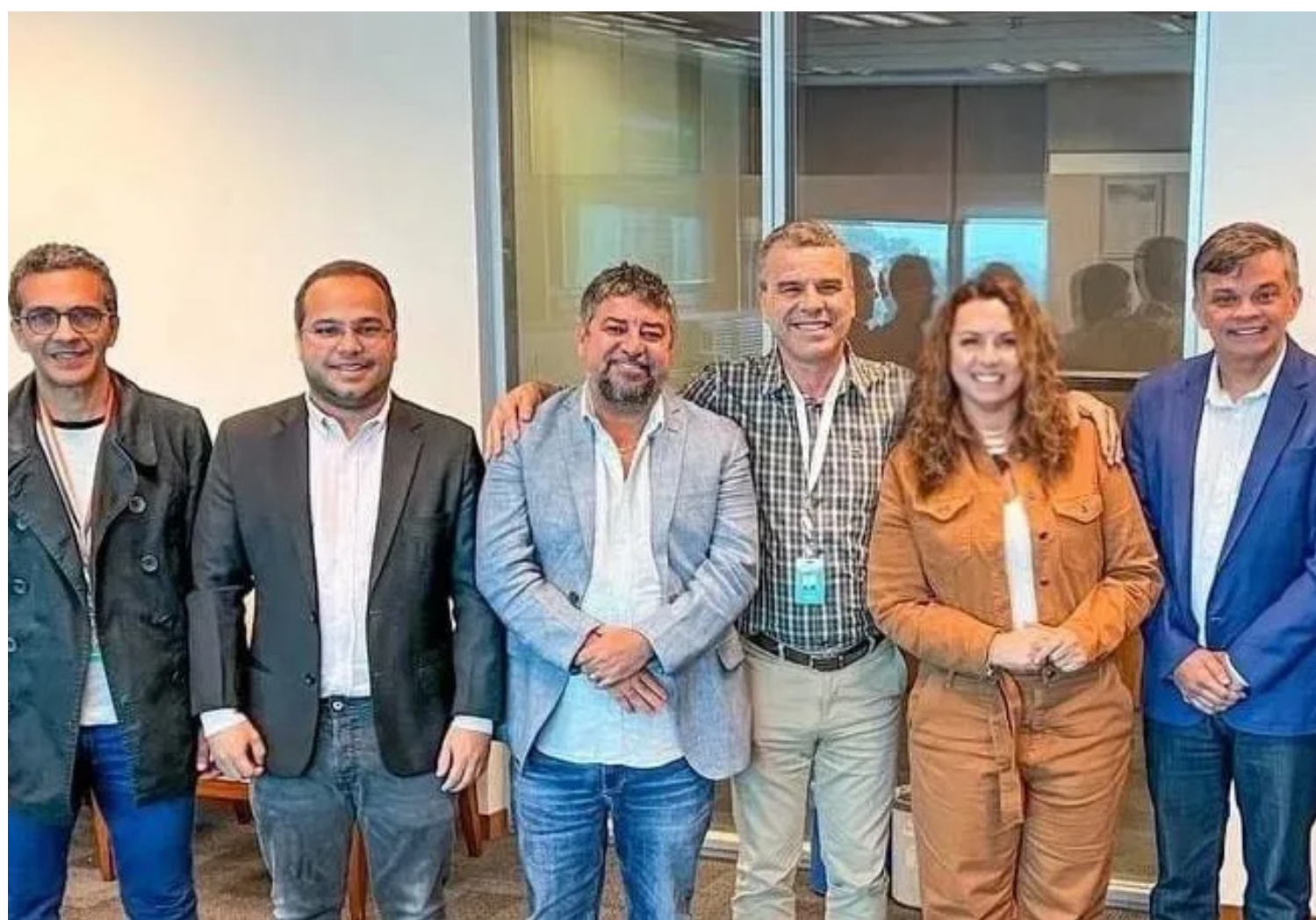
trazer um novo rumo para o Estado do Rio de Janeiro",

"O governo federal está comprometido com o Estado e com nossa região, investimentos que vão gerar oportunidades e principalmente desenvolvimento. A retomada do Comperj, assim como da indústria naval vai