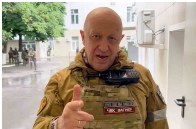
Prigozhin foi protagonista de um motim contra a cúpula das forças militares russas há alguns meses

O chefe do grupo de mercenários Wagner, Yevgeny Prigozhin, morreu, nesta quarta-feira (23/8), após o avião em que ele estava cair na Rússia. A informação foi amplamente divulgada pela imprensa russa, que depois voltou atrás, às 14h31 (horário de Brasília), e informou que o líder estava na lista de passageiros da aeronave. O mercenário foi protagonista de um motim contra a cúpula das forças militares russas em junho.