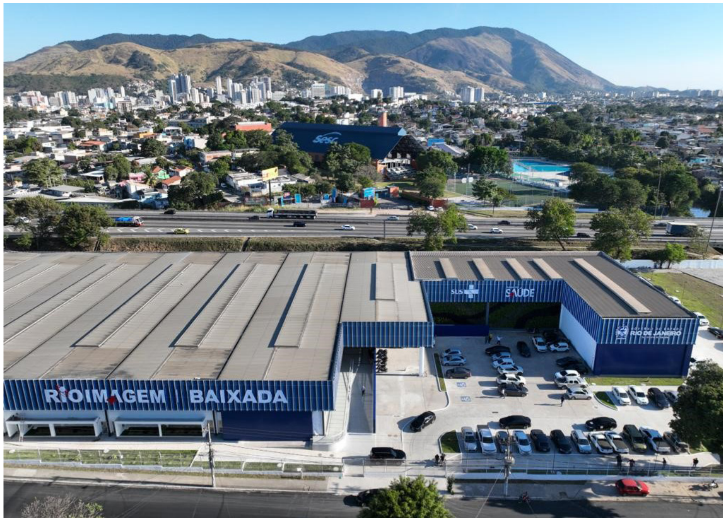
Ao lado do complexo de imagem será construído o Hospital do Câncer, está em análise construção de unidade especializada em oftalmologia