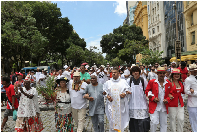
2ª Procissão do Zé Pelintra saindo do santuário nos Arcos da Lapa e finalizando na Cinelândia, no centro da cidade, com um ato contra a intolerância religiosa.

A lei que institui sanções administrativas para quem causar danos às estruturas físicas ou símbolos religiosos será sancionada de forma integral. Durante a sessão ordinária da terça (22), a Câmara do Rio rejeitou o veto parcial aposto pelo Poder Executivo à Lei 8000/2023. Com isso, os trechos vetados agora serão validados. A prefeitura tinha vetado incisos da norma que proibem a contratação pela administração pública dos autores desses danos a símbolos religiosos, e determinam a reparação dos prejuízos causados. A proposta é de autoria dos vereadores Átila A. Nunes (PSD), Cesar Maia (PSDB), Monica Benício (PSOL), Marcelo Arar (PTB), Dr. Marcos Paulo (PSOL), Matheus Gabriel (PSD), Alexandre Beça (PSD), William Siri (PSOL), Luciano Medeiros (PSD), Luiz Ramos Filho (PMN), Marcio Ribeiro (Avante), Monica Cunha (PSOL), Vera Lins (PP), William Coelho (DC) e Inaldo Silva (Rep).