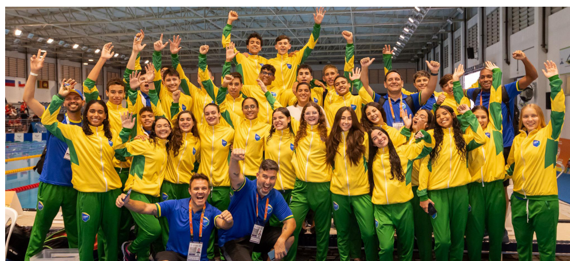
Jogos Mundiais Escolares Sub-15 acontecem no Parque Olímpico do Rio até o dia 26, com investimentos de R$ 5 milhões do Governo do Estado; Brasil já acumula medalhas

O clima é de competição olímpica: atletas concentrados, técnicos com as últimas orientações e a vontade de vencer que dá para perceber nos olhos. A Gymnasiade 2023, também conhecida como Jogos Mundiais Escolares Sub-15, começou na segunda-feira (21/08) com a delegação brasileira ocupando o segundo lugar no quadro de medalhas, atrás apenas da Inglaterra. Pelo menos até agora. Até o dia 26 de agosto, mais de 1.400 estudantes-atletas de 46 países vão mostrar tudo o que sabem em buscar do pódio daquele que é considerado o maior evento escolar do mundo. Realizada com investimentos de R$ 5 milhões do Governo do Rio, a competição acontece nos mesmos equipamentos das Olimpíadas Rio2016. — Está sendo incrível reviver toda aquela emoção dos Jogos Olímpicos aqui no Rio mais uma vez. A Gymnasiade começou muito bem, até agora a delegação brasileira está em segundo lugar no ranking, atrás apenas da Inglaterra, que também tem ótimos atletas. Está sendo bacana acompanhar as disputas, não falta adrenalina. São mais de 40 delegações, diferentes culturas, e tudo isso em um ambiente esportivo muito saudável. Os atletas estão muito entusiasmados e a