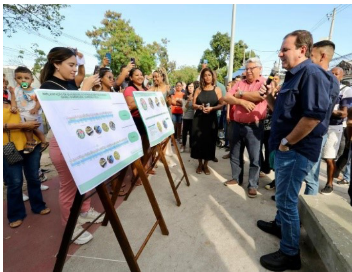
Intervenção vai dobrar o número de quiosques na área, instalar equipamentos de lazer e esporte, além de novo paisagismo