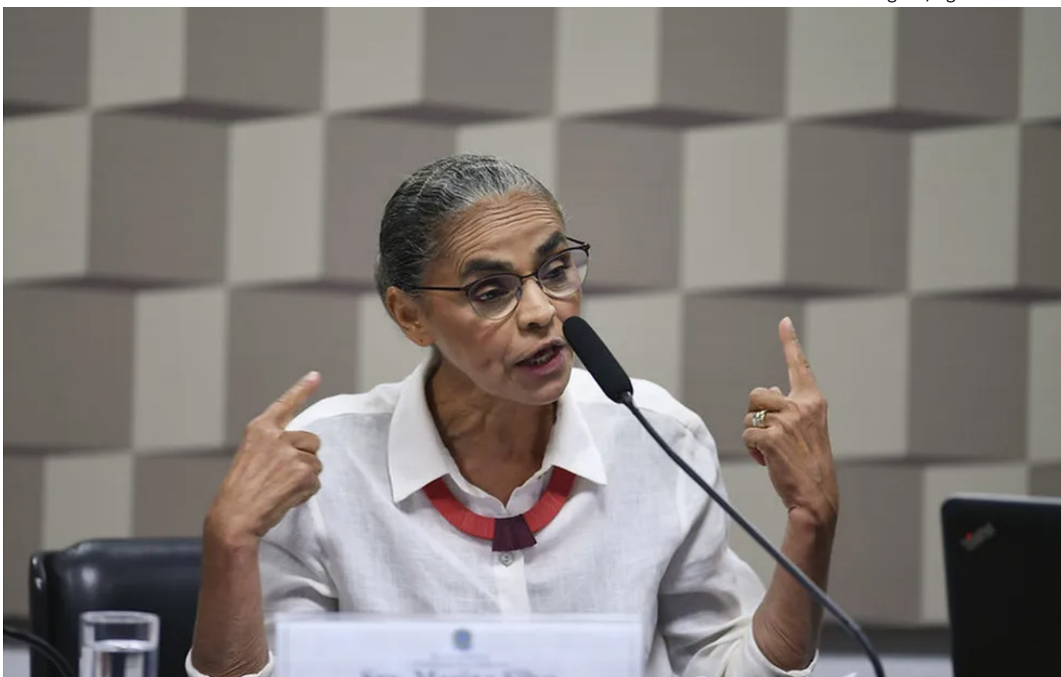
A ministra Marina Silva durante audiência Comissão de Meio Ambiente do Senado