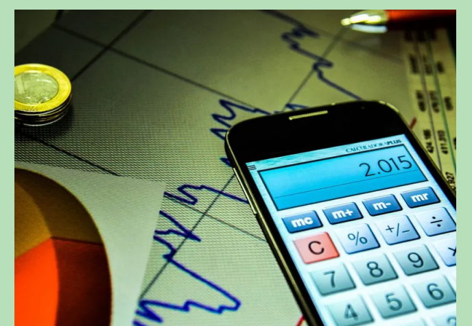
Brasil tem menor nível de incerteza econômica desde 2017

O termômetro usado pelo IIE-Br para medir a expectativa do mercado é o Boletim Focus, divulgado semanalmente pelo Banco Central. A edição desta segunda-feira traz expectativa de queda da inflação e da taxa Selic, a taxa básica de juros da economia.