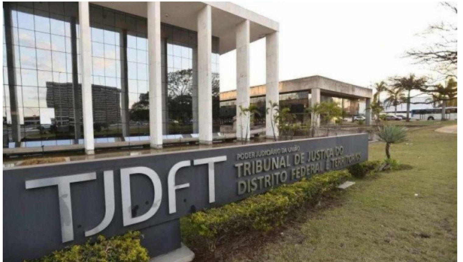
Por conta do problema, diversos servidores foram orientados a não tentar acessar a internet ou os sistemas da corte, gerando paralisação das atividades em diversos departamentos

trata de um problema físico em um dos equipamentos. "A Secretaria de Tecnologia da Informação do Tribunal de Justiça do Distrito Federal e dos Territórios (SETI/TJDFT) informa que, nesta segunda-feira, 24/7, em virtude de falha física em um componente da rede central, vários sites e sistemas do TJDFT ficaram inacessíveis. O site já foi restabelecido e a equipe técnica está atuando em conjunto com os fornecedores para solucionar o problema com prioridade, mediante troca do equipamento defeituoso e, assim, restabelecer os demais serviços de informática o mais brevemente possível", destaca o texto. Um aviso foi emitido para advogados informando que, por conta de instabilidade técnica, os prazos processuais serão prorrogados. Com isso, processos nos quais os prazos de recursos, contestação, apelação, notificação das partes, entre outras situações, ficam