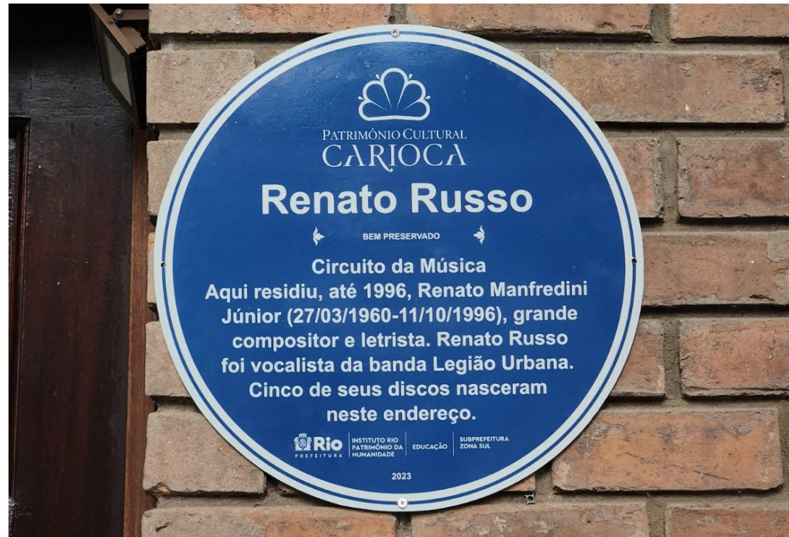
A placa foi instalada no prédio onde Renato Russo morou, em Ipanema

O trabalho de identificação de um patrimônio cultural da cidade é realizado pelo IRPH, órgão vinculado à Secretaria Municipal de Planejamento Urbano, que garante a identificação de bens e locais ligados à cultura e à identidade do Rio. Por meio da fixação de uma placa informativa, a Prefeitura seleciona locais de destaque para cada tema. Em cada placa, os visitantes podem saber um pouco mais sobre o local e sua importância para a história da cidade e