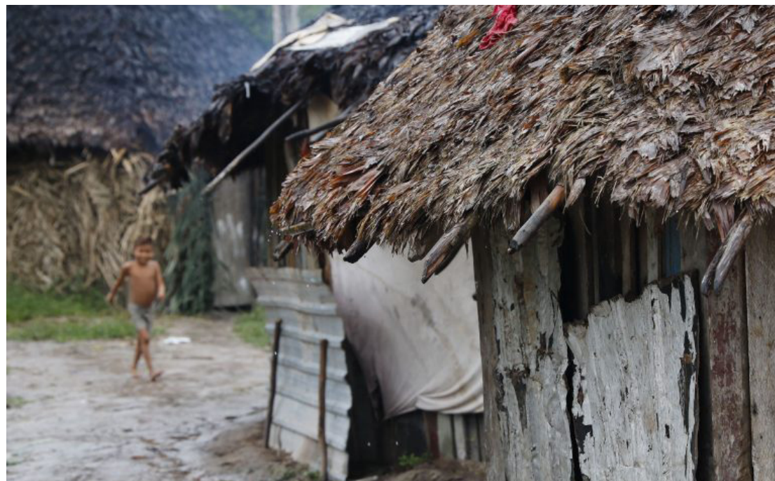
Texto aprovado restringe demarcação a terra ocupadas antes de 1988

No primeiro semestre, o Plenário da Câmara dos Deputados aprovou 46 projetos de lei, 17 medidas provisórias, 18 projetos de decreto legislativo, 3 projetos de resolução, 2 projetos de lei complementar e 1 proposta de emenda à Constituição (PEC). Na área de Meio Ambiente, a Câmara aprovou o projeto de lei sobre o marco temporal da ocupação de terras por povos indígenas, restringindo a demarcação àquelas terras já tradicionalmente ocupadas por esses povos em 5 de outubro de 1988, data da promulgação da nova Constituição Federal. O Projeto de Lei 490/07 está em análise no Senado e foi aprovado na forma de um substitutivo do relator, deputado Arthur Oliveira Maia (União-BA). Segundo o texto, para serem consideradas terras ocupadas tradicionalmente, deverá ser comprovado objetivamente que elas, na data de promulgação da Constituição, eram, ao mesmo tempo, habitadas