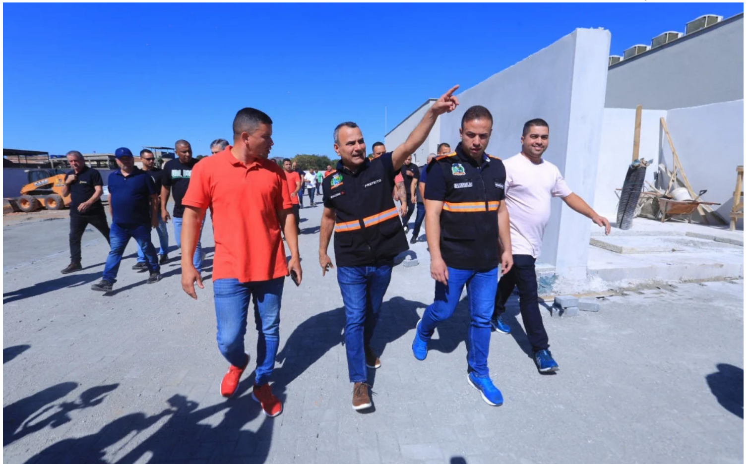
A comitiva do prefeito Waguinho visitou a nova UPA Bom Pastor e algumas ruas do bairro

Avanços na saúde. O prefeito de Belford Roxo, Wagner dos Santos Carneiro, o Waguinho (Republicanos), visitou as obras de construção da nova Unidade de Pronto Atendimento (UPA) Bom Pastor. Ao lado de uma comitiva de secretários e autoridades municipais, o prefeito fiscalizou os últimos detalhes para inaugurar a unidade no bairro.