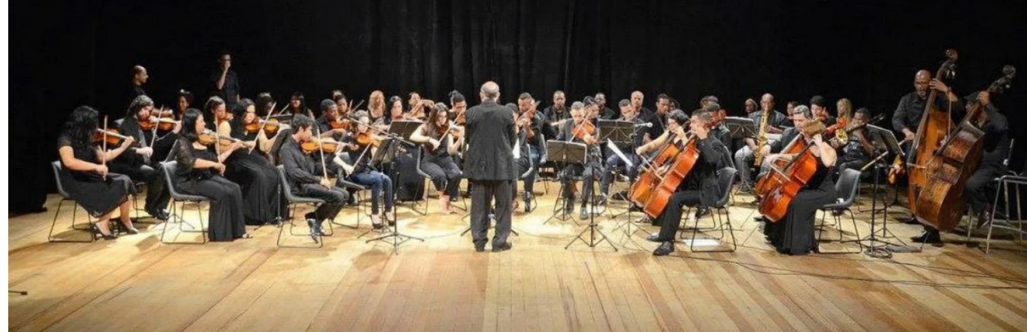
Dia 31 a Orquestra Sinfônica da Baixada Fluminense vai realizar concerto em Meriti, no Instituto Léo Vieira de Assistência e Capacitação no centro de São João de Meriti

Concerto Beneficente em prol dos protetores de animais cadastrados na associação Guerreiros Pet.