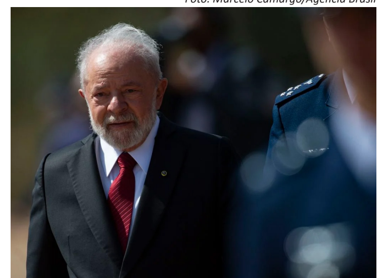
Brasília (DF), 20/07/2023 - O presidente Luiz Inácio Lula da Silva durante cerimônia em homenagem aos 150 de nascimento de Alberto Santos Dumont, patrono da Aeronáutica e considerado o Pai da Aviação