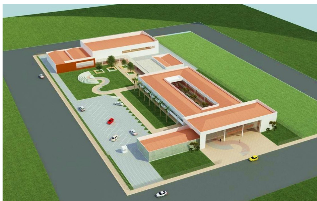
Projeto do campus do Instituto Federal do Rio de Janeiro no Complexo do Alemão

- Este é um momento superimportante, tem alguns anos que esperamos a vinda do IFRJ para a cidade. Foi um compromisso que o presidente Lula assumiu durante a campanha e agora está cumprido - afirmou Eduardo Paes, que assinou o documento de desapropriação do terreno. O IFRJ, instituição federal de ensino público e gratuito, atua em diferentes níveis e modalidades de ensino, com opções desde a formação inicial e continuada, ensino téc-