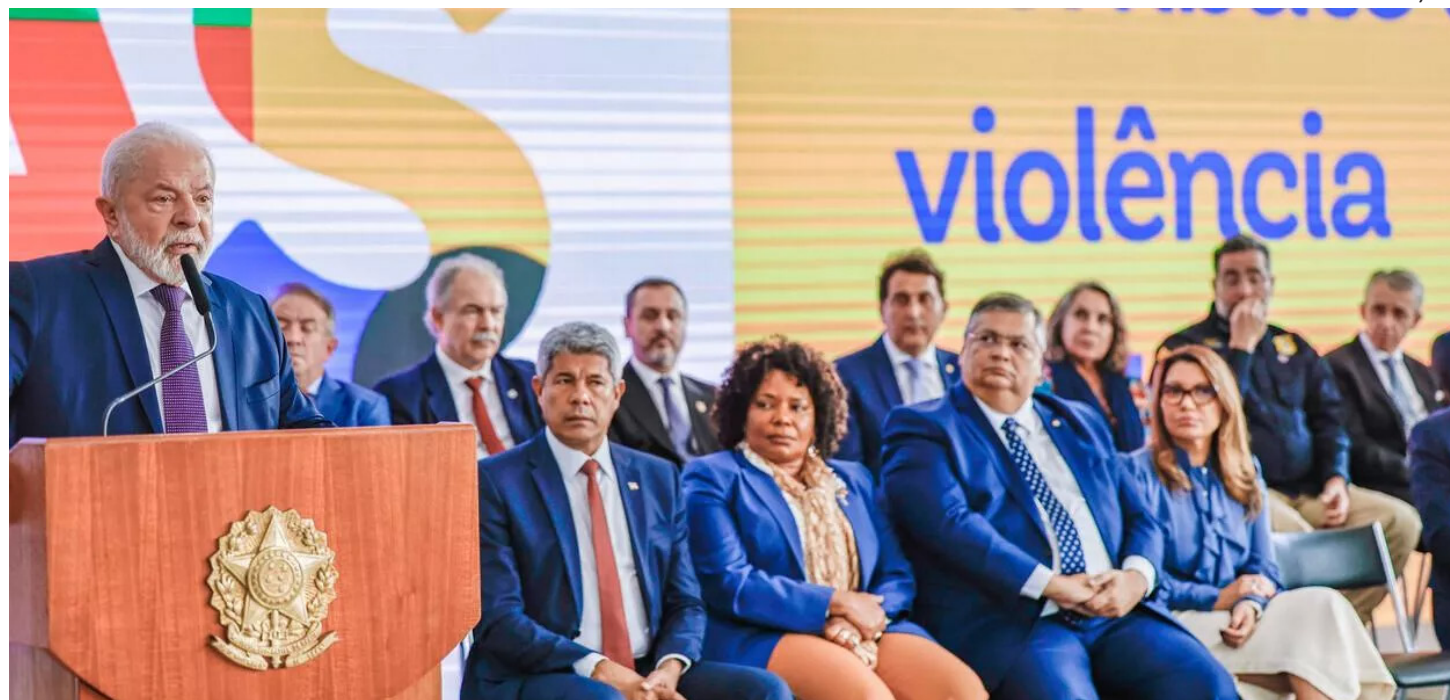
Luiz Inácio Lula da Silva

O presidente Lula (PT) afirmou ontem, durante o programa "Conversa com o presidente", que Jair Bolsonaro (PL) flexibilizou o acesso a armas de fogo durante seu governo para "agradar o crime organizado". Ele ainda prometeu fechar "quase todos" os clubes de tiro no Brasil. >>> Lula diz que negociação com o Centrão é "normal" e visa "dar tranquilidade ao governo" no Congresso