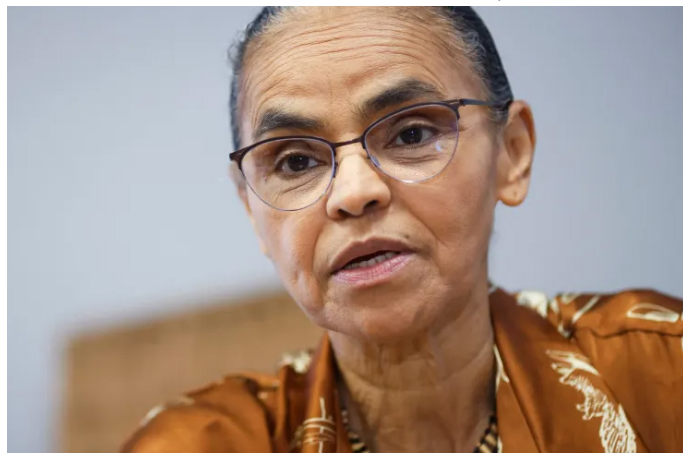
Ministra disse que haverá reforço no combate a incêndios florestais, mais frequentes com o El Niño combate