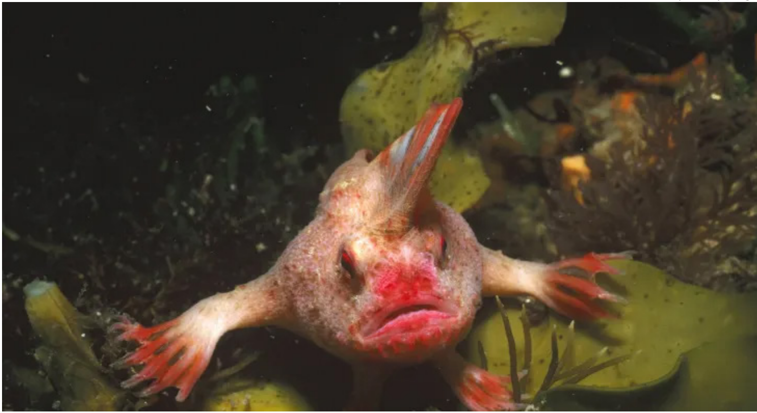
Peixe-mão-vermelho, Thymichthys politus , espécie rara e criticamente ameaçada de extinção.

Nas profundezas escuras e lamacentas do rio Derwent, no estado australiano da Tasmânia, um tipo incomum de peixe pode ser encontrado caminhando ao longo do leito do rio.