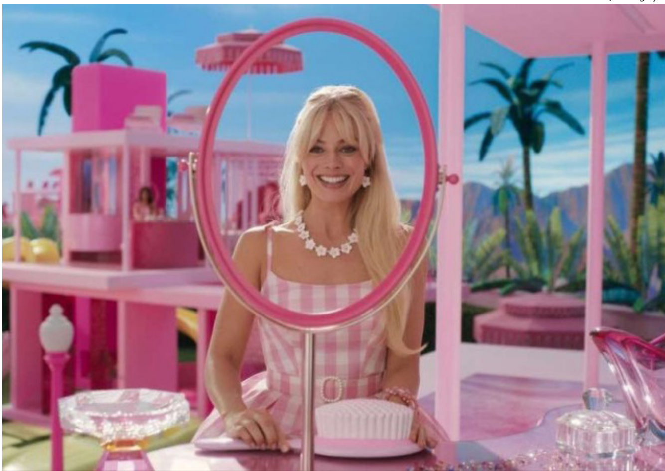
Cena do filme "Barbie", com Margot Robbie e Ryan Gosling.