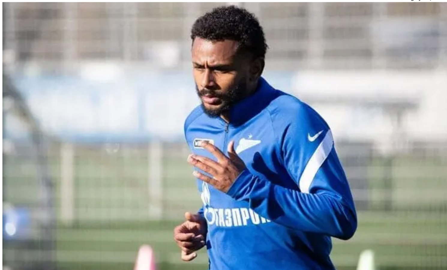
Flamengo se distancia de De La Cruz e volta atenções para Wendel