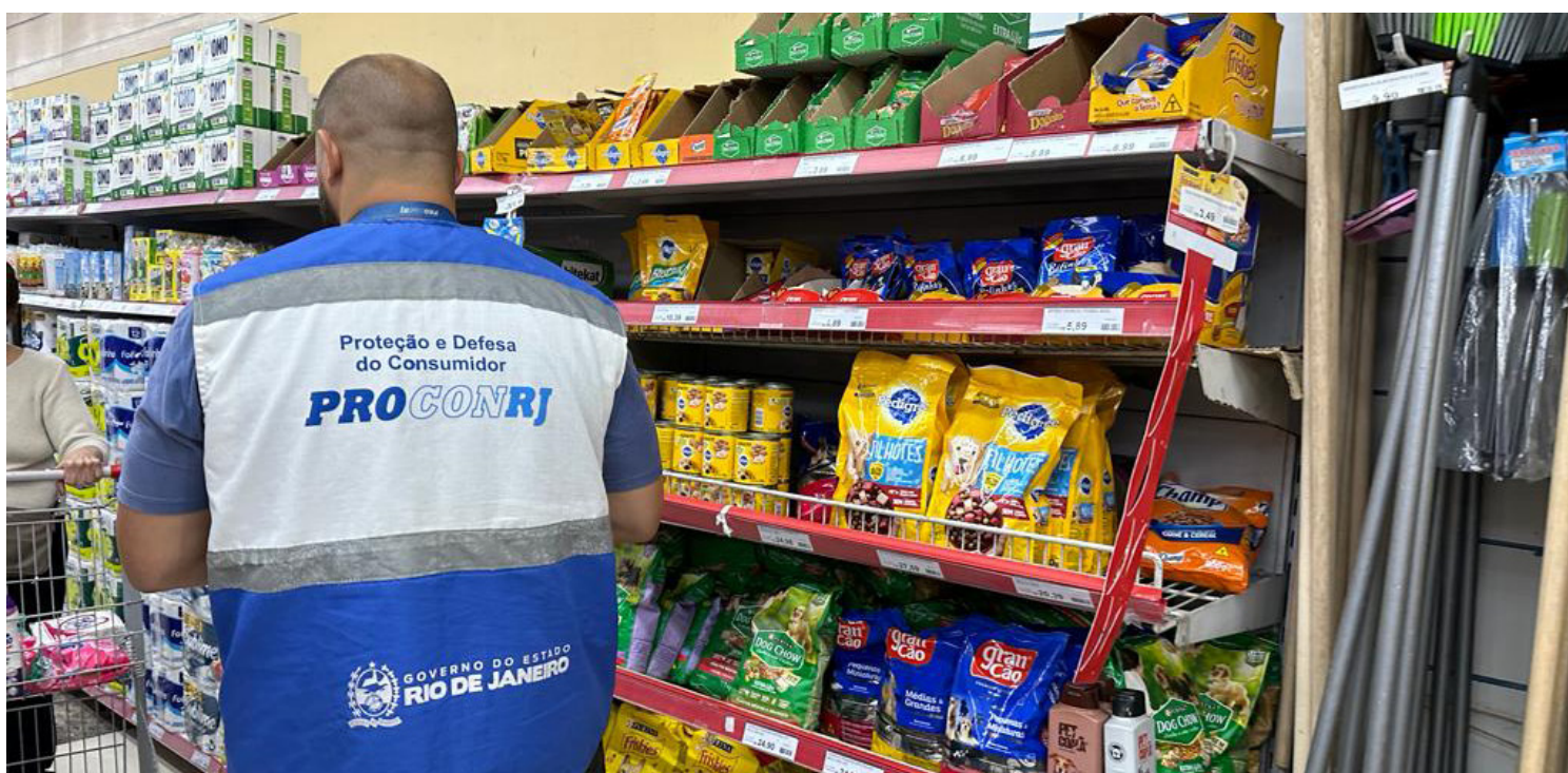
200 quilos de alimentos impróprios são descartados em fiscalização do Procon Estadual na Região Metropolitana do Rio.

O consumidor que desejar fazer denúncias ou reclamações, poderá acessar nossos canais de atendimento disponíveis no site oficial da autarquia: www.procon.rj.gov.br .