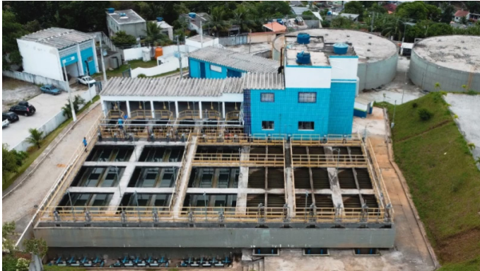
Manutenções da Cedae interrompem abastecimento na Baixada.

12h e 14h. A produção de água vai ser interrompida nas estações durante o período. Moradores de Duque de Caxias e Japeri devem economizar água porque a operação dos sistemas somente será retomada após a conclusão dos serviços.