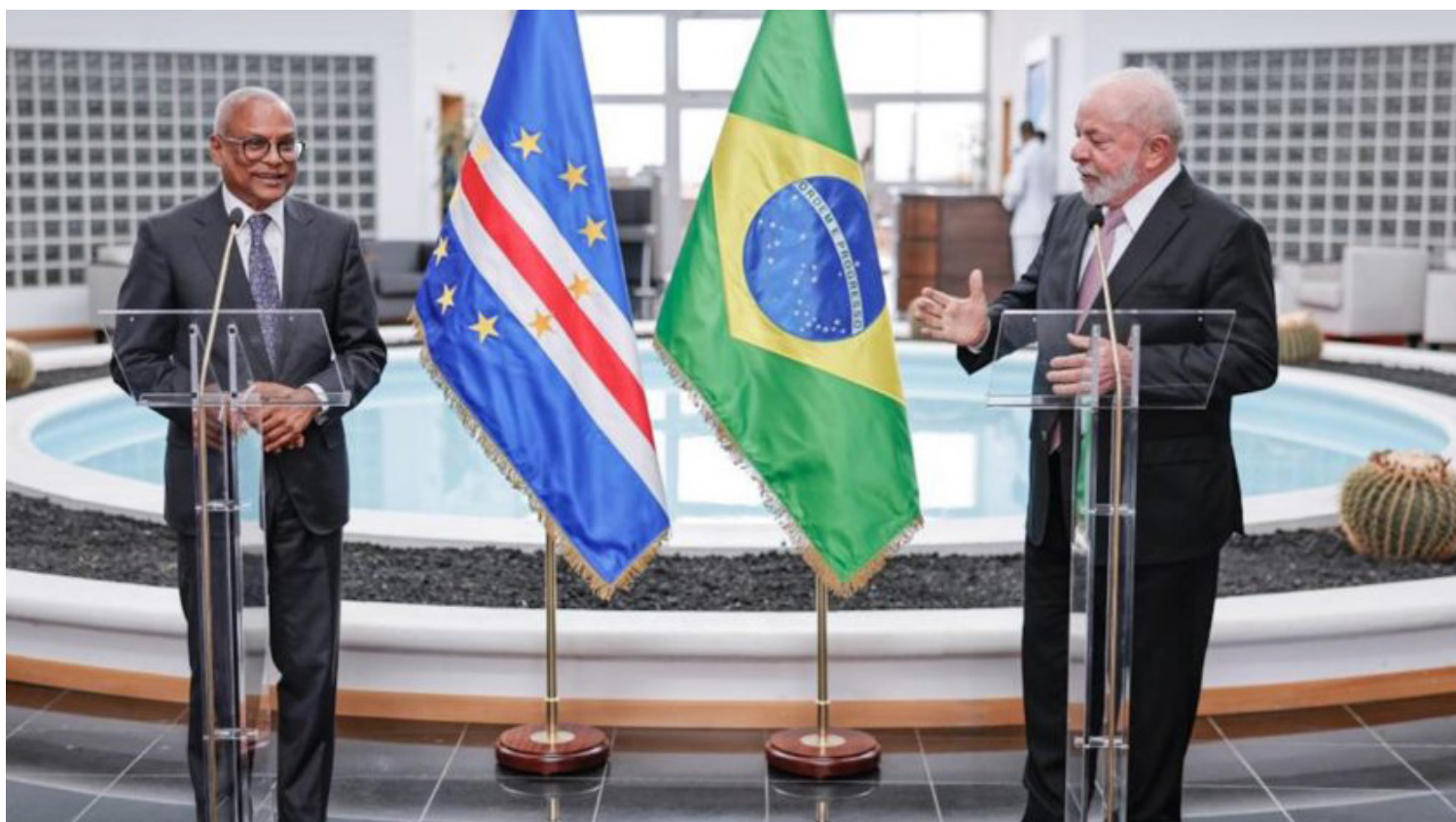
O presidente Luiz Inácio Lula da Silva (à dir.) ao lado do presidente de Cabo Verde, José Maria Neves, fez breve pronunciamento após reunião entre os 2 em Praia, capital do país africano

zer [trecho da transmissão ao vivo interrompido] é a possibilidade de formação de gente para que tenham especialização nas várias áreas que o continente africano precisa, para a possibilidade de industrialização e de agricultura”, disse. Lula fez um breve pronunciamento em Praia, capital de Cabo Verde, depois de ter se reunido com o presidente do país, José Maria Neves. O chefe do Executivo brasileiro fez uma escala no local em sua volta ao Brasil, depois de ter participado por 2 dias da 3ª Cúpula entre a União Europeia e a Celac (Comunidade de Estados Latino-americanos e Caribenhos), realizada em Bruxelas, na Bélgica. A escala é obrigatória porque o avião presidencial não tem autonomia de voo suficiente e precisa parar para reabastecimento. Lula e a primeira-dama, Janja Lula da Silva, querem trocar a aeronave por uma que tenha maior capaci-