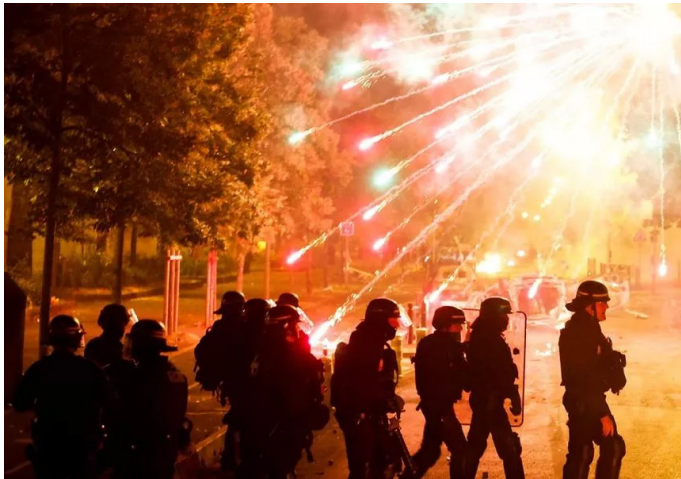
Distúrbios e confrontos com a polícia na França após assassinato de um adolescente em Nanterre

A justiça então pronunciou mais de 400 sentenças a penas de prisão efetivas.