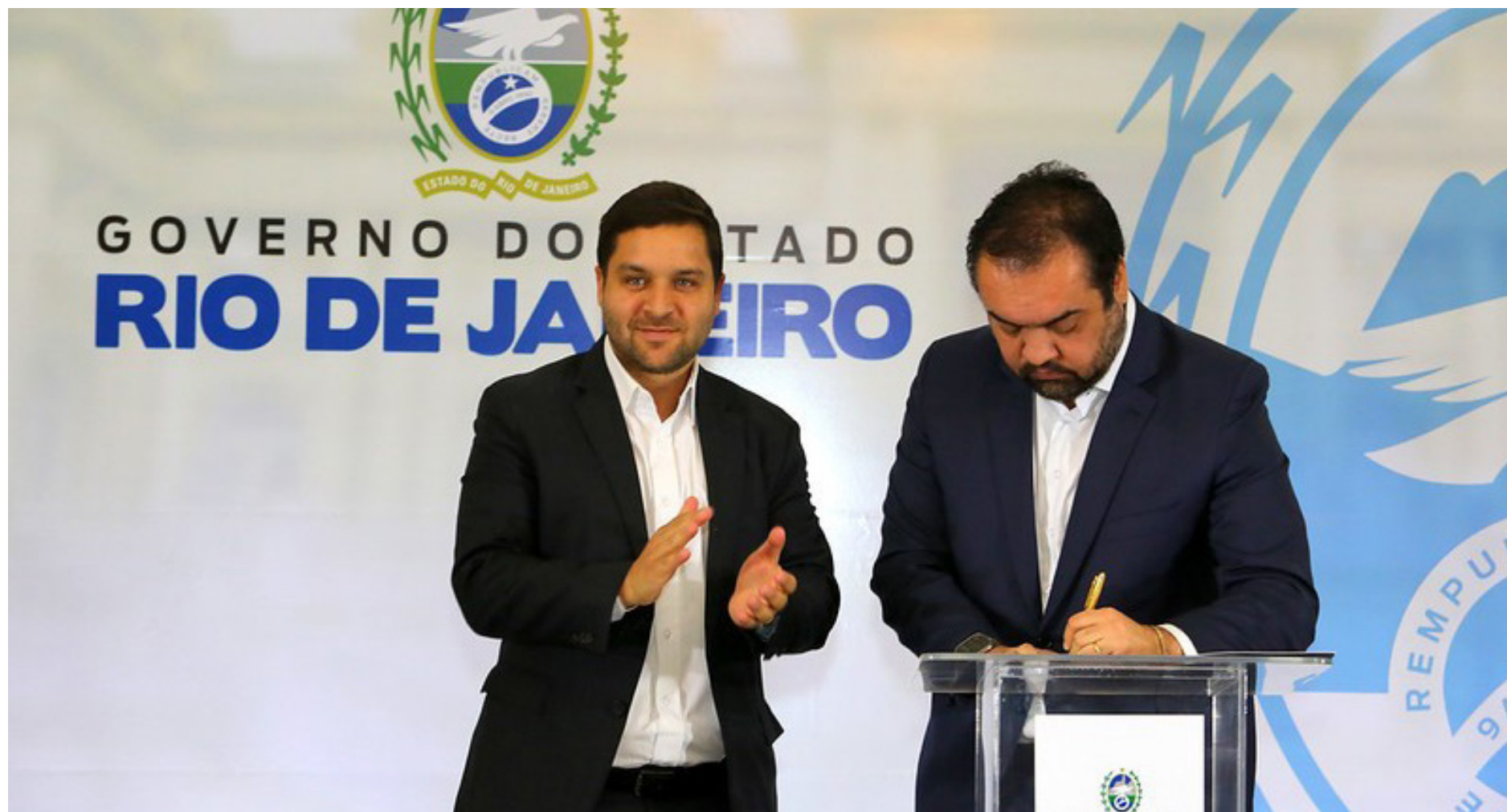
Governador Cláudio Castro sanciona leis que garantem incentivos fiscais e estimularão a geração de emprego e renda no Rio de Janeiro. (Philippe Lima)

- Estamos garantindo, com a segurança jurídica necessária, incentivos para setores estratégicos da economia do Rio de Janeiro. São medidas que vão estimular a geração de emprego e renda. Também estamos tirando do papel uma lei de extrema relevância social, que isenta absorventes femininos de ICMS, ajudando a erradicar um problema de saúde que acomete muitas meninas e moças, sobretudo com menos recursos – declarou Cláudio Castro, ressaltando o papel que a Assembleia Legislativa teve ao aprovar as matérias. Todas as propostas foram