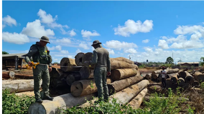
Ao todo foram aplicados R$ 937 milhões em multas em Mato Grosso

No primeiro semestre de 2023, cerca de R$ 937 foram aplicados em multas por crimes ambientais no estado de Mato Grosso, segundo a Secretaria Estadual de Meio Ambiente (Sema-MT).