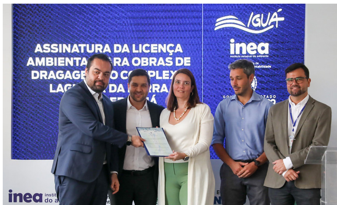
Governador assina licença ambiental para obras de dragagem no Complexo Lagunar da Barra e de Jacarepaguá. (Rafael Campos)

O governador Cláudio Castro e o vice-governador Thiago Pampolha assinaram, nesta terça-feira (18/7), a licença ambiental para obras de dragagem no Complexo Lagunar da Barra e de Jacarepaguá, na Zona Oeste da capital fluminense. A ação é a concretização de uma promessa olímpica do Rio de Janeiro, assumida antes da Rio 2016. As intervenções, promovidas pela concessionária Iguá, beneficiarão as Lagoas da Tijuca, de Jacarepaguá, do Camorim e de Marapendi e o Canal da Joatinga. Com o investimento de R$ 250 milhões, cerca de 2,3 milhões de metros cúbicos de lodo e sedimentos serão removidos do fundo das lagoas da região. - O que muda o mundo é o que a gente está fazendo hoje. É diminuir o tempo de uma licença ambiental e começar uma obra dessa. É perceber que nós conseguimos tirar do papel uma ação dessas, que antes ficava no sonho e no imaginário das pessoas. A gente quer esse complexo lagunar 100% limpo. E o que o estado precisar, nós faremos - afirmou o governador Cláudio Castro. As intervenções permitirão o restabelecimento do fluxo de água nas lagoas, possibilitando a oxigenação e as trocas com o mar - importantes para a melhoria na qualidade e renovação da água - além do reequilíbrio do ecossistema e aumento da biodiversidade. Cerca de um milhão de pessoas serão beneficia-