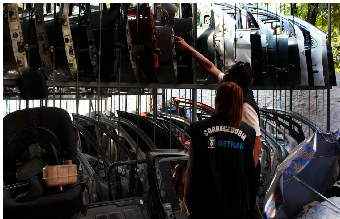
Operação permanente contra o desmanche de automóveis vai fiscalizar ferros-velhos, lojas de autopeças e oficinas mecânicas do estado do Rio. (Alexandre Simonini)

operar regularmente no Estado do Rio, as empresas dos ramos de desmontagem, reciclagem, recuperação e comercialização de partes ou de peças de veículos automotores têm que se credenciar no Detran RJ. As informações sobre o credenciamento estão na portaria Detran RJ nº 6295, de 19 de setembro de 2022, que normatiza os procedimentos técnico-operacionais deste segmento no estado. Os estabelecimentos podem se credenciar no protocolo geral do Detran RJ (na sede, na Avenida Presidente Vargas, 817, Centro) ou pelo Sistema Eletrônico de Informações - SEI, via usuário externo. Os ferros-velhos de fora da capital podem recorrer às Ciretrans do Detran RJ. Em junho, o Governo do Esta-