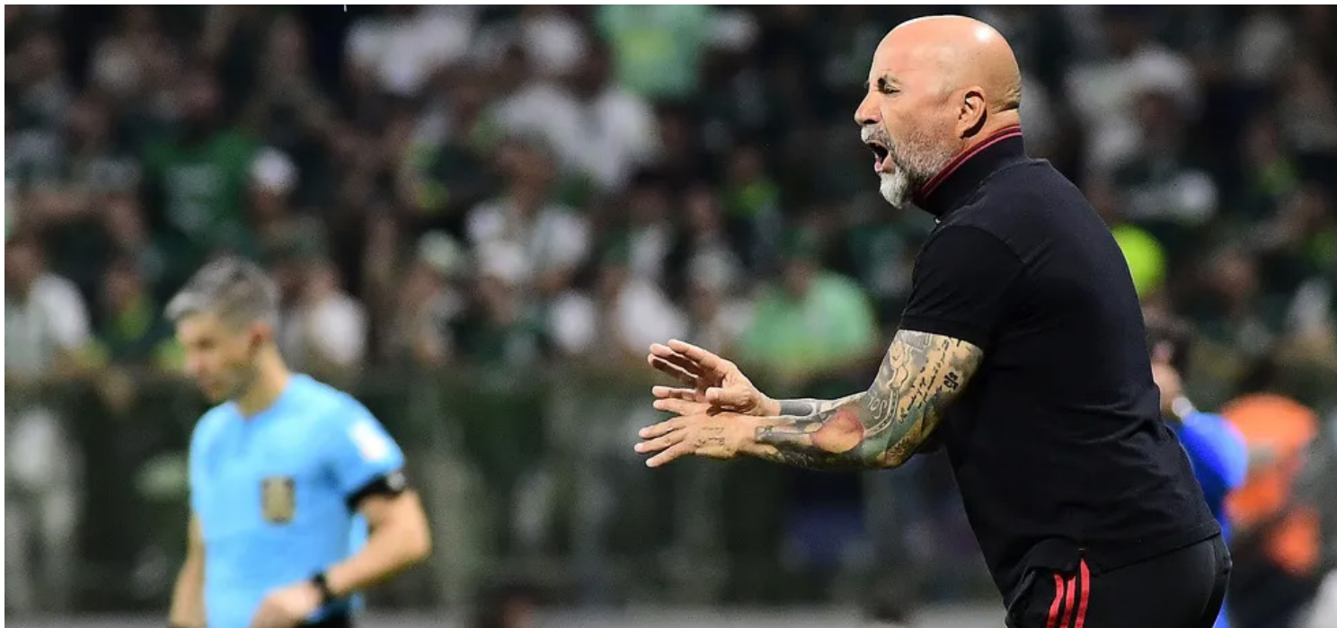
Sampaoli em jogo do Flamengo

A necessidade é de repor a saída de Vidal. É uma necessidade que o time tem e estamos buscando alternativas nessa posição de volante misto. Um time para lutar coisas importantes em um ano difícil, de transição, tem que ter a possibilidade de ter um jogador que resolva, por si só, determinadas coisas no campo - disse o técnico após o empate com o Fluminense.