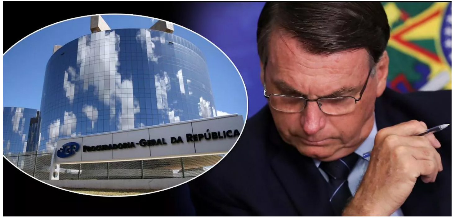
PGR e Jair Bolsonaro