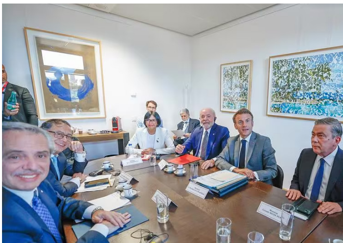
Presidente Lula durante reunião com o presidente da França, Emmanuel Macron, o presidente da Argentina, Alberto Fernández, o presidente da Colômbia, Gustavo Petro, e a Vice-Presidente da Venezuela, Delcy Rodríguez.

A vice-presidente venezuelana, Delcy Rodríguez, recebeu autorização para viajar à capital da Bélgica apesar de estar incluída na lista de sancionados do bloco europeu. Segundo autoridades diplomáticas, a permissão de Rodríguez permanecer no espaço europeu foi prorrogada para participar da cúpula, um precedente previsto no regulamento das sanções europeia. Essa iniciativa dá seguimento ao debate sobre a situação na Venezuela, organizado pelo Presidente da República Francesa no Fórum pela Paz de Paris, em novembro de 2022.