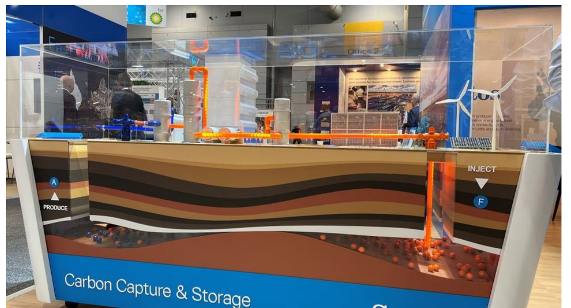
Vista de um modelo de captura e armazenamento de carbono projetado pela Santos Ltd, na conferência da Australian Petroleum Production and Exploration Association em Brisbane, Austrália, em 18 de maio de 2022.

Essas tecnologias "devem ser consideradas no contexto das etapas para eliminar gradualmente o uso de combustíveis fósseis e devem ser reconhecidas como tendo um papel mínimo a desempenhar na descarbonização do setor de energia", acrescentou o comunicado.