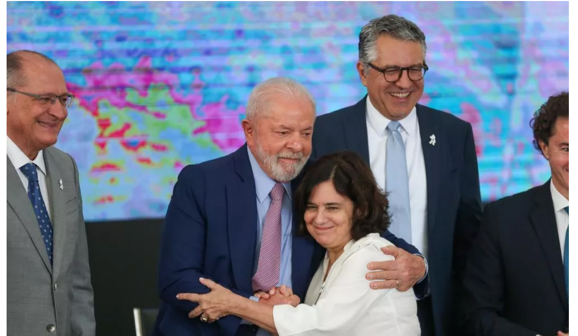
Fiocruz que já tive boas informações dela'. Foi o Padilha, que sonhava em voltar a ser ministro da Saúde, que trouxe a Nísia para conversar comigo".

ex-ministros, todos muito bons, a começar do primeiro, Humberto Costa, depois o [José Gomes] Temporão, depois o [Arthur] Chioro, depois o [Alexandre] Padilha. E tinha mais dois, que foram ministros, o Saraiva Felipe, de Minas Gerais, o Agenor [Álvares]. E eu fiquei pensando: toda essa gente vai querer voltar a ser ministro, afinal de contas foram ministros, foram provados, então vão querer voltar. Mas o Padilha foi muito digno, porque eu falei: 'Padilha, olha, acho que precisamos encontrar uma mulher para ser ministra da Saúde'. E ele foi o primeiro a falar para mim: 'tem uma senhora na