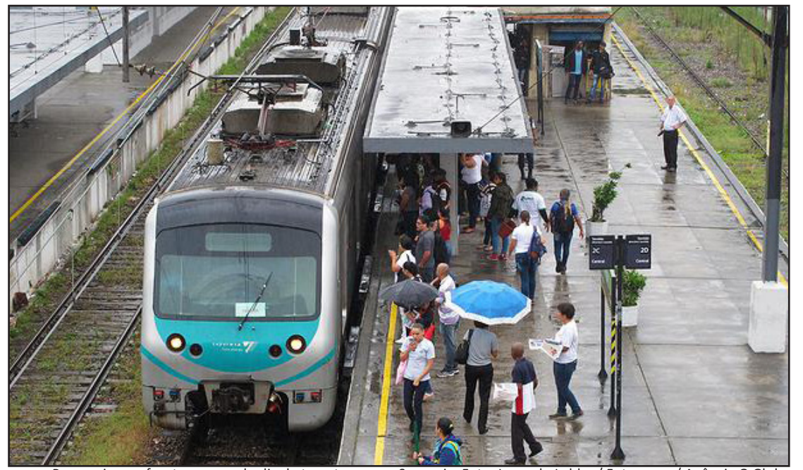
Passageiros enfrentam segundo dia de transtornos na SuperVia.

A SuperVia também alega que não teve condições de realizar o investimento previsto para o trecho entre Santa Cruz e Itaguaí, em cerca de R$ 51 milhões, porque o Estado do Rio de Janeiro não efetuou as desapropriações de terra naquelas localidades para a passagem da ferrovia.