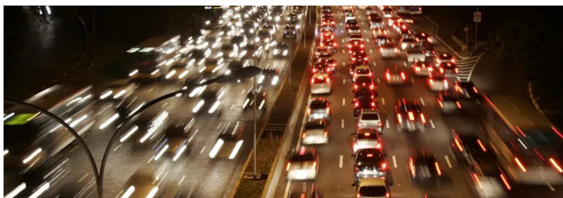
Retorno ao mercado brasileiro do chamado carro popular entrou na agenda do governo

O segmento de atividades turísticas, analisado separadamente pela pesquisa, apresentou variação de 0,1% em março, depois de uma queda de 1,3% em fevereiro. Com o resultado, o setor do turismo está 1,4% acima do patamar pré-pandemia (fevereiro de 2020), mas 5,9% abaixo do ponto mais alto da série (fevereiro de 2014).