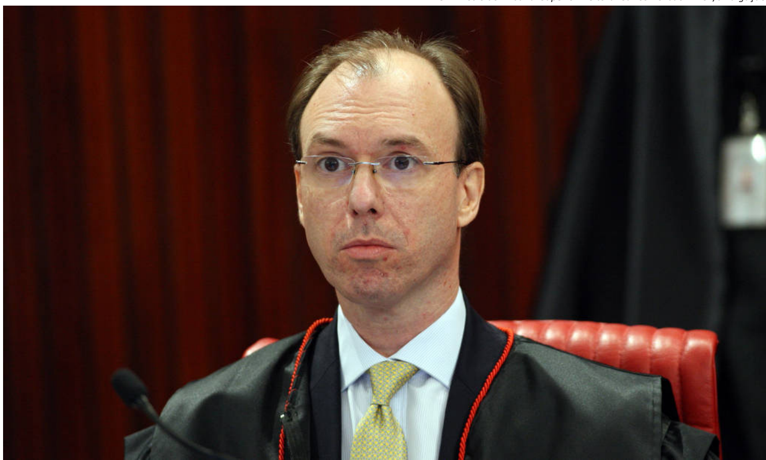
O ministro do Tribunal Superior Eleitoral Carlos Horbach

O mandato de Horbach no TSE termina nesta quinta-feira (18), e recentemente ele informou ter aberto mão da recondução. Como Horbach havia se posicionado a favor de Bolsonaro e seus aliados em julgamentos importantes, a sua permanência —que em última instância depende de indicação do Planalto— já era dada como improvável antes de sua desistência formal. Um dos julgamentos em que